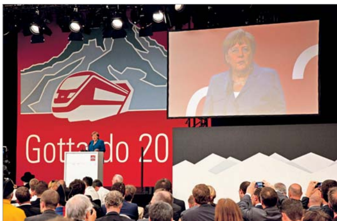
Zu den zahlreichen anwesenden Regierungschefs bei der Eröffnung zählte auch die deutsche Bundeskanzlerin Angela Merkel.

Vereint im großen Festzelt von Pollegio war jetzt die Bühne frei für die Staatschefs, die bisher gut bewacht und abgeschirmt wurden. Viel Lob und Freundlichkeiten für das Jahrhundertbauwerk durften die Schweizer entgegennehmen, aber auch Versprechungen. Die charmanteste Rede hielt wohl Österreichs neuer Bundeskanzler Christian Kern, bis vor kurzem selbst Bahnchef der ÖBB. Angela Merkel punktete vor allem mit dem Versprechen, den Ausbau der Zufahrtsstrecken rasch vorantreiben zu wollen. Das wurde gern gehört und sie erntete dafür auch anhaltenden Applaus. François Hollande hielt wohl die längste Rede, geprägt vom europäischen Gedanken. Denn der Bahntunnel, ein Produkt der Schweizer Innovation, Präzision und Zuverlässigkeit und mit 12,15 Milliarden ohne ausländische Beiträge durch die Schweiz finanziert, bildet das Herzstück des europäischen Nord-Süd-Schienenkorridors Rotterdam/Antwerpen – Genua. Bis zur vollen Funktionalität dauert es aber noch. Bis 2020 werden der Ceneri-Basistunnel sowie die schweizerischen Zulaufstrecken ausgebaut sein. Anders sieht es in den Nachbarländern aus, wo noch Handlungsbedarf besteht.