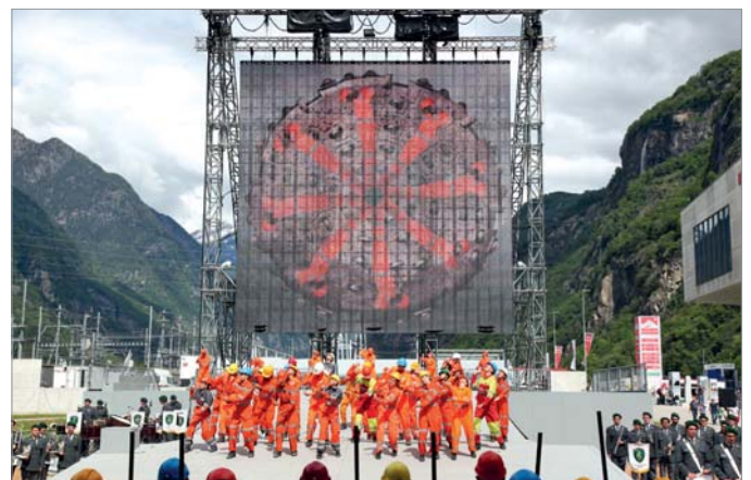
Auch dem einfachen Volk wurde am Festwochenende ein großes Showprogramm geboten.