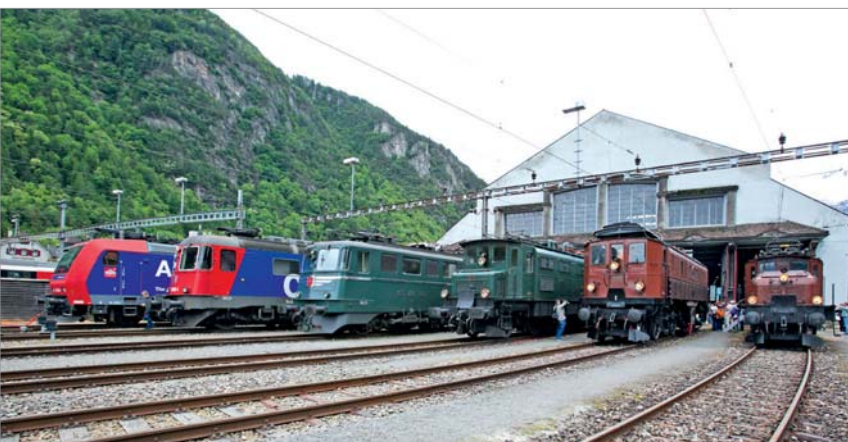
Eine Fahrzeugschau in Erstfeld, organisiert von SBB Historic, mit aktuellen und historischen Vertreterinnen des Gotthard-Verkehrs war Teil des Programms.

Nun bleibt noch die intensive Schulung von 3900 Mitarbeitenden der SBB und Drittfirmen, bis am 11. Dezember 2016 der Fahrplanbetrieb im längsten Eisenbahntunnel der Welt beginnen und auf der Gotthard-Strecke alles anders werden wird.