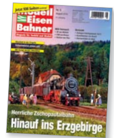
Modell: Rivarossi

Bereits seit 150 Jahren besteht die bekannte Verbindung von Chemnitz zur Bergstadt Annaberg-Buchholz.