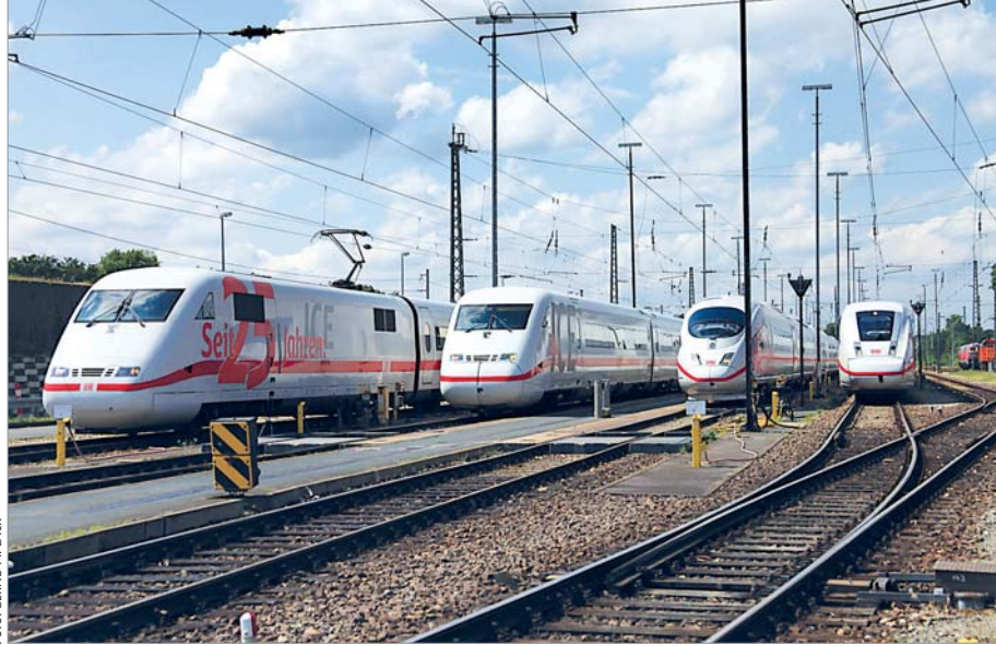
Die Deutsche Bahn präsentierte am 2. Juni 2016 mit einer Jubiläums-Aufschrift versehene Vertreter aller vier ICE-Generationen gemeinsam in Berlin-Grunewald.

□ Die ICE-Familie feierte jüngst den 25. Geburtstag. Am 29. Mai 1991 wurde der Betrieb mit den weißen Rennern im Rahmen einer Sternfahrt zum damals neuen ICE-Bahnhof Kassel-Wilhelmshöhe aufgenommen. Nachdem andere Industriestaaten wie Japan oder Frankreich längst modernen Hochgeschwindigkeitsverkehr auf der Schiene etabliert hatten, startete die Bundesbahn mit einiger Verspätung ins neue Zeitalter. Entsprechend groß waren daher die Erwartungen sowohl seitens der DB als auch der Fahrgäste. Einen schmerzlichen Tiefpunkt erlebte die ICE-Geschichte mit der Katastrophe von Eschede 1998. Letztendlich hat sich das ICE-System im Rahmen seiner Möglichkeiten aber dennoch bewährt. Inzwischen ist mit dem ICE4 die vierte Fahrzeuggeneration am Start. Keine Frage,