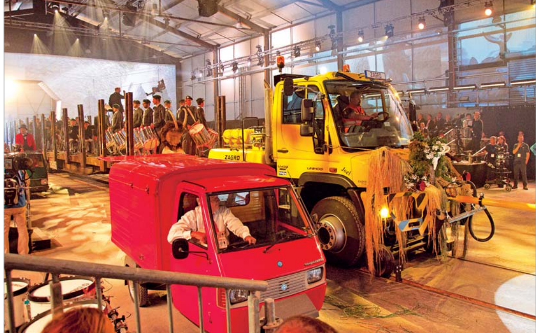
Mit einer imposanten und lautstarken Show unter Beteiligung von 600 Akteuren wurde die Gotthard-Eröffnung vor 1100 geladenen Gästen gefeiert.

Gleichzeitig starteten zwei ICN (InterCity-Neigezüge) mit 1000 Passagieren, die aus 160 000 Bewerbern für die allererste Tunneldurchfahrt ausgelost worden waren. Der eine Zug fuhr ab Arth-Goldau in Richtung Süden, der andere ab Bellinzona nordwärts.