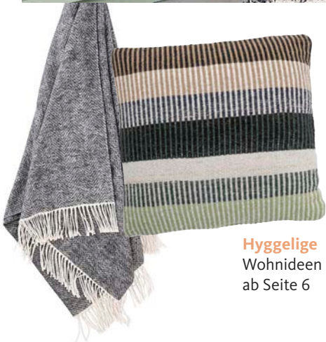
Hyggelige Wohnideen ab Seite 6