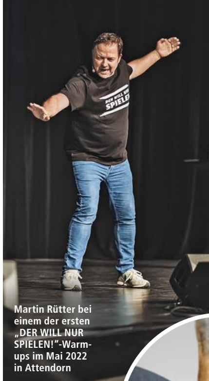
Martin Rütter bei einem der ersten „DER WILL NUR SPIELEN!“-Warm-ups im Mai 2022 in Attendorn

Und das Bühnenbild ist unser Stichwort. Denn heute ist es erstmals zu sehen – in der Schwabenhalle auf dem Augsburger