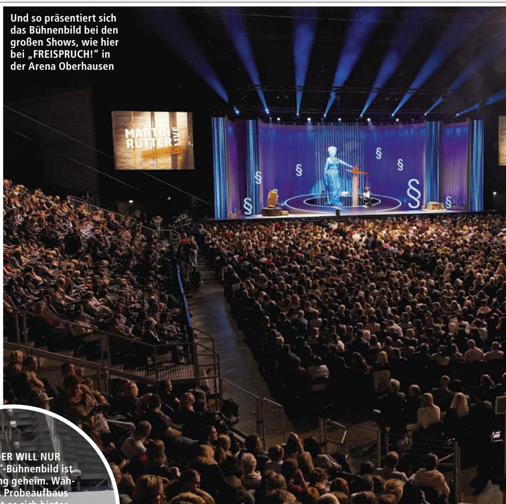
Und so präsentiert sich das Bühnenbild bei den großen Shows, wie hier bei „FREISPRUCH!“ in der Arena Oberhausen

Und apropos Aufwand, der geht jetzt weiter. Denn ab jetzt wird rumprobiert, ausprobiert und auch schon feinjustiert. Dut-