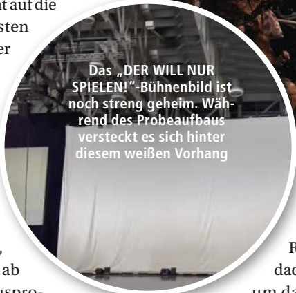
Das „DER WILL NUR SPIELEN!“-Bühnenbild ist noch streng geheim. Während des Probeaufbaus versteckt es sich hinter diesem weißen Vorhang

zende Male wird der Kabuki in Richtung Hallendach gezogen werden, um dann wieder zu Boden zu fallen. Fragen wie „Welcher Schweinwerfer strahlt wann wohin?“, „Wann soll künftig die Intro- und Outromusik einsetzen?“, „Sieht Requisite B zwei Meter rechts neben dem angedachten Standort nicht viel besser aus?“ Damit werden sich Martin und seine Crew den kompletten Nachmittag über beschäftigen.