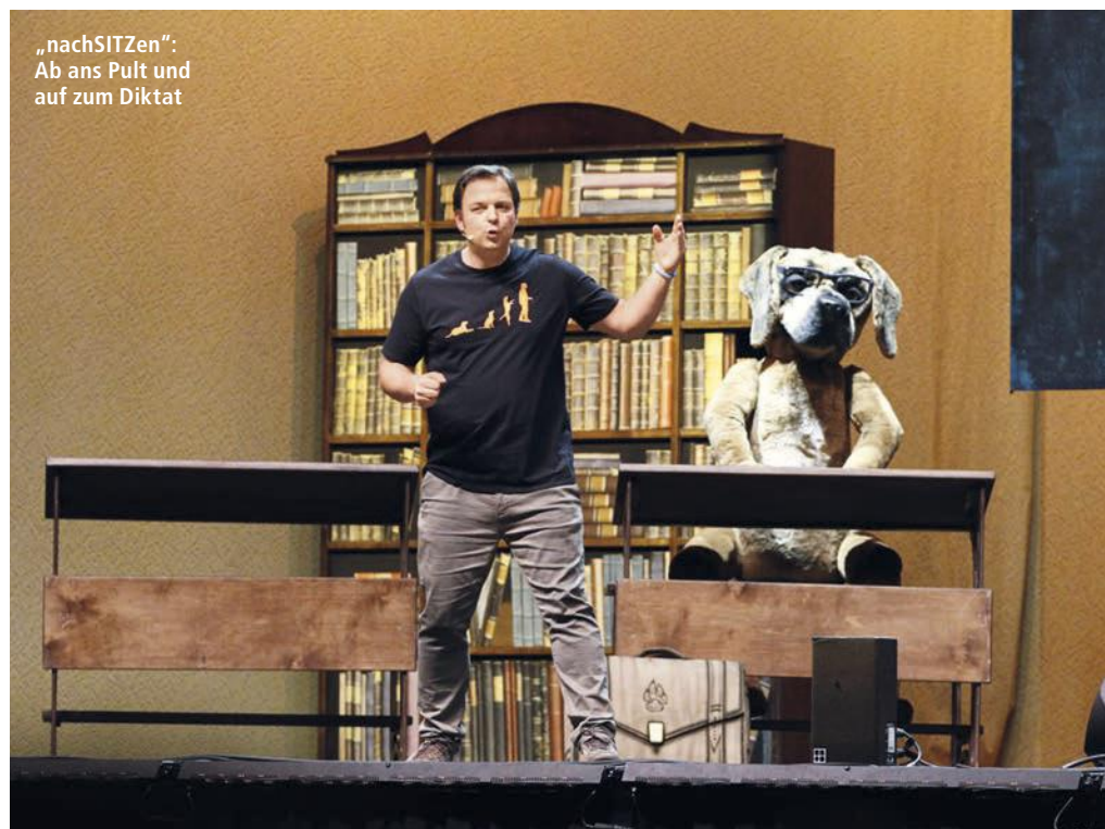
„nachSITzen“: Ab ans Pult und auf zum Diktat

Mach das nicht. Nach den Warm-ups habe ich registriert, dass dieses Finale die Leute schon sehr berührt. Einige Menschen haben sogar geweint. Die Mehrzahl hat die Halle nach der Show aber sehr befreit verlassen und gesagt: Das ist nun mal ein Thema und ich finde es gut, dass es auch