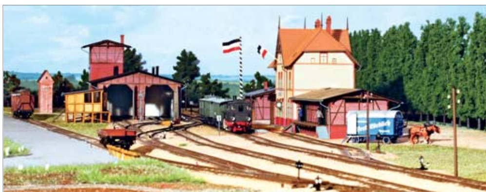
30 Alles hat ein Ende ... nein, mitnichten, denn in Ziesar endeten zwei Bahnstrecken. Im Wandel der Zeit veränderten sich die Endbahnhöfe. Folgen Sie den Spuren vergangener Zeiten.