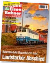
Titel: BR 218 Modelle: Roco

Von einst über 400 Loks der BR 218 sind inzwischen nur noch etwa 80 Maschinen im täglichen Plandienst gefordert, beispielsweise in Niebüll, Ulm und Kempten.