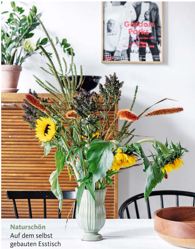
Naturschön Auf dem selbst gebauten Esstisch stehen Wildblumen