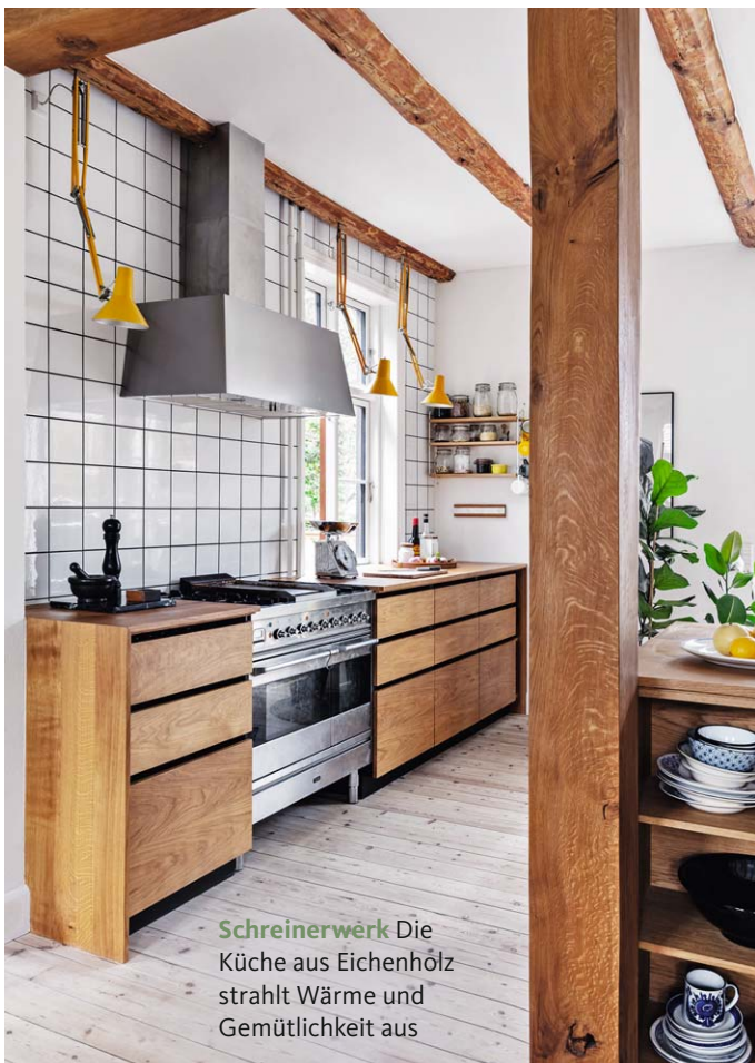
Schreinerwerk Die Küche aus Eichenholz strahlt Wärme und Gemütlichkeit aus