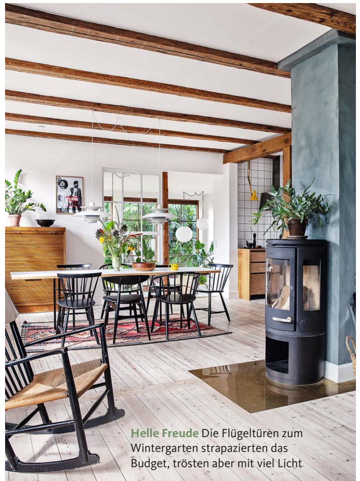
Helle Freude Die Flügeltüren zum Wintergarten strapazierten das Budget, trösten aber mit viel Licht