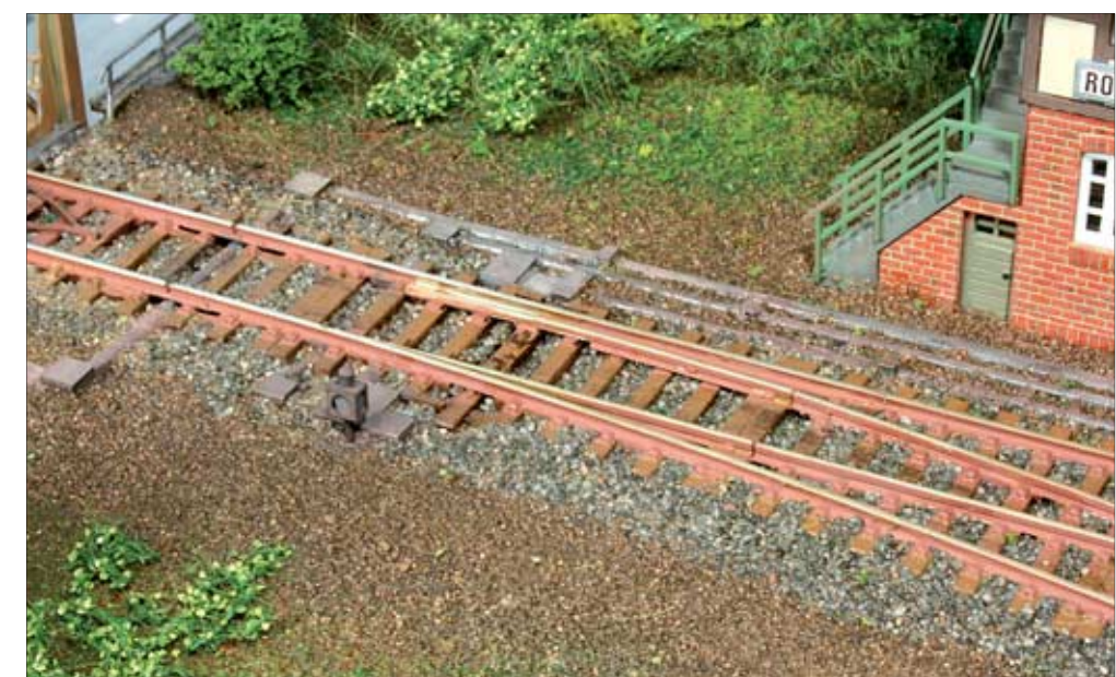
24 Die Seilzüge mechanischer Stellwerke hat Thomas Mauer in H0 nachgebildet und er beschreibt, was es in dieser Beziehung alles zu beachten gibt.