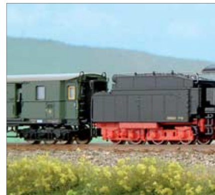
68 Über einen motivierten Spurwechsel und seine Folgen berichtet Horst Schulz. Die neue Anlage in Modulbauweise wurde im Maßstab 1:45 gebaut (links).