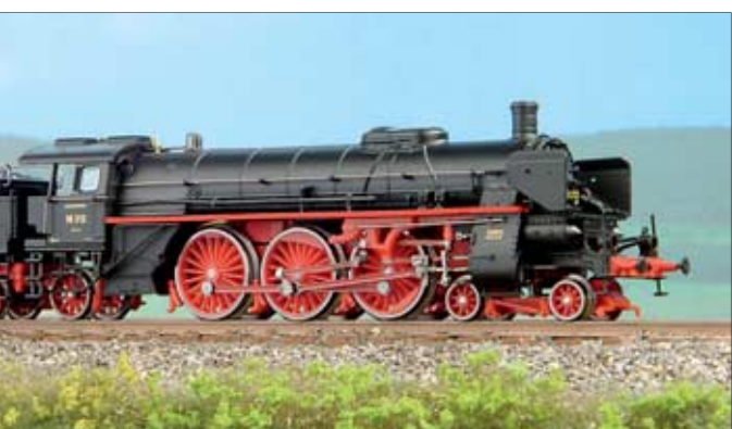
80 Im MIBA-Test: Das rasige N-Modell der badi-schen Schnellzuglok 18.3 von Hobbytrain (links)