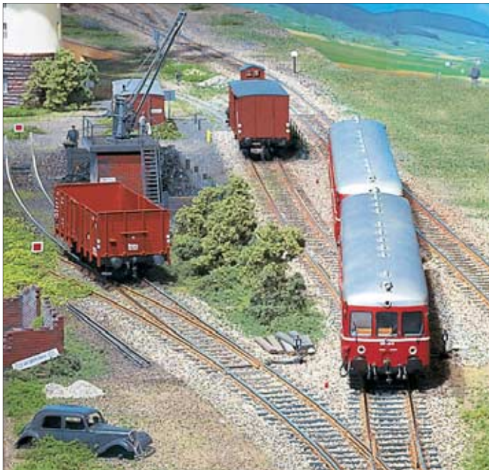
8 Um Landschaftsgestaltung und Staubschutz geht es in dieser Folge unseres N-Anlagenberichts rund um den fiktiven Bahnhof „Genthin“.