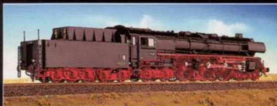
PRÄZISIONSAUSFÜHRUNG, ANTRIEB IN DER LOKOMOTIVE!