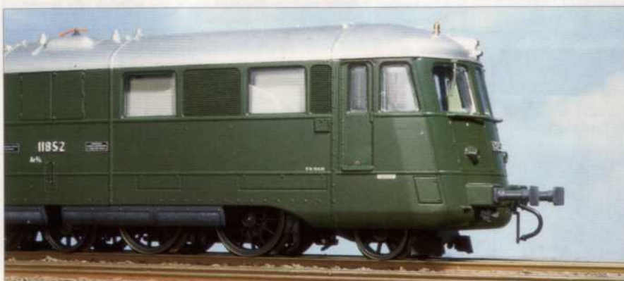
16 Die „Landi-Lok“ erscheint zum diesjährigen Schweizer Bahnjubiläum gleich in zwei Ausführungen – Roco hat sein H0-Modell der Ae 8/14 inzwischen an den Fachhandel ausgeliefert. Grund genug für einen Testbericht, den Bernd Beck für alle MIBA-Leser durchführte.