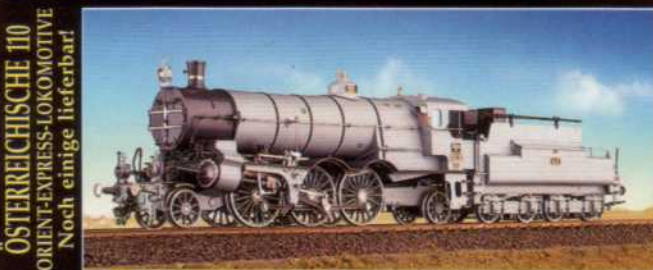
ÖSTERREICHISCHE 110 ORIENT-EXPRESS-LOKOMOTIVE Noch einige lieferbar!