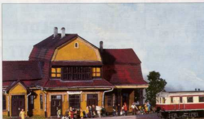
86 Einen Modellbahnhof für ein Museum baute Wolfgang Borgas – mit einem Plexiglas-Kern, damit das H0-Empfangsgebäude auch etwas aushält! Wie er dabei vorgegangen ist, schildert der Autor im heutigen Beitrag.