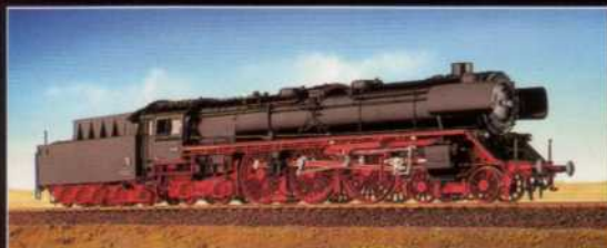
DB BR 05 001 & 05 002 "WELTREKORD-LOKOMOTIVE"