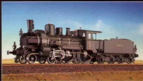
BAY. B XI ZWILLING, DRG BR 367 3 bayerische Versionen 2 Reichsbahn-Versionen Sofort lieferbar!

Feinste Messing-Handarbeitsmodelle H0 1:87