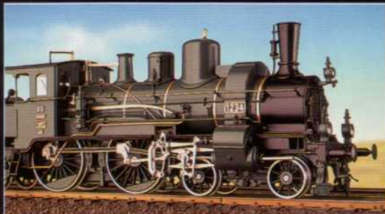
SUPERDETAIL BAY. B XI ZWILLINGSVERSION!