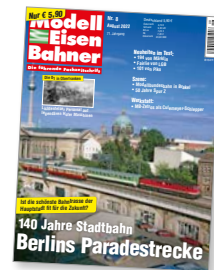
Titel: Schnellzug mit 232 705 und S-Bahn der Baureihe 476 am 9. Juni 1998 auf der Berliner Museumsinsel.

Zunächst war es nur ein kühner Gedanke, doch er wurde vor 140 Jahren Wirklichkeit: Noch immer erschließt die Stadtbahn wie kaum eine andere Verkehrsader das Zentrum Berlins. Seit 1882 ist die auf ihren berühmten Arkaden über die Straßen der Stadt hinweg führende Strecke mit der Geschichte und dem Schicksal dieser Metropole untrennbar verbunden.