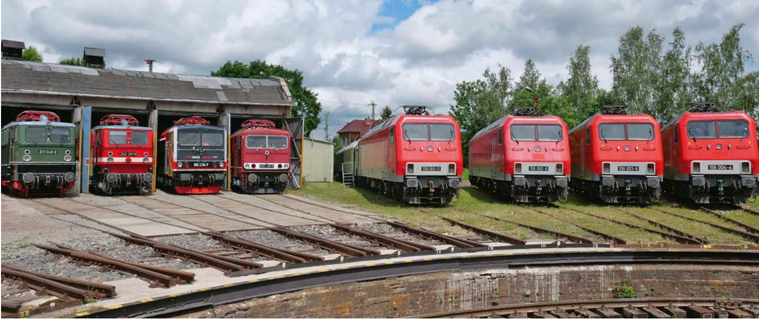
■ Anlässlich der Saisonöffnung 2022 des Thüringer Eisenbahnvereins. im Eisenbahnmuseum Weimar stand dieses Jahr eine Lokparade der gesamten Baureihe 156 auf dem Programm. Alle vier Lokomotiven 156 001, 002, 003 und 004 gehören zum Lokbestand der Erfurter Bahnservice GmbH mit Sitz in Erfurt. Die Panorama-Aufnahme zeigt neben den 156 weitere DR-Klassiker vor dem Lokschuppen in Weimar.