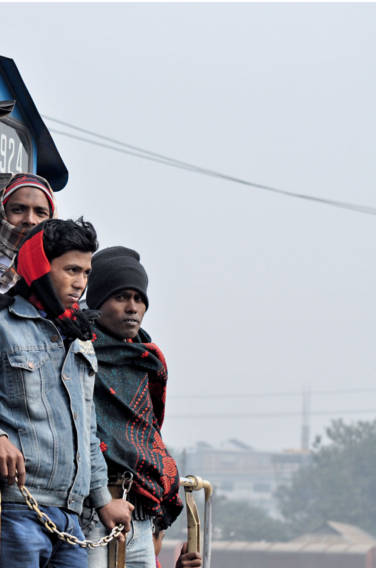
Reisen ohne Ticket – in Bangladesch darf man das auf der Lokomotive und auf den Dächern der Waggons. Gefährlich und ungemütlich ist es allemal (Tongi Junction, 9. Januar 2015).