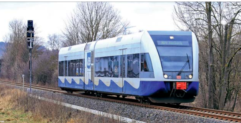
Mit 646 104 ist derzeit ein UBB-Zug im KHB-Netz unterwegs, hier am 29. Dezember 2017 in Korbach. Ein weiterer UBB-646 soll folgen.

ihrer vorherigen Einsatzplanung (geplante Ablösung im Dezember 2017 durch Pesa-Link) nur noch wenige Monate Restlaufzeiten und müssen deshalb im Frühjahr 2018 in die Revision. Da sich die Bestandszüge der KHB im Umbau befinden, mussten nun noch von der Westfrankenbahn (WFB) fünf 642 ausgeliehen werden, wobei einer (642 006) die baden-württembergische Drei-Löwen-Takt-Lackierung trägt. Aufgrund anstehender Instandsetzungsarbeiten an Zügen der Baureihe 646 und wegen des unfallbedingten Ausfalls eines 646 befindet sich derzeit auch 646 104 der Usedomer Bäderbahn (UBB) im Einsatz. Es ist davon auszugehen, dass aufgrund anstehender Revisionen an den 642 der KHB weitere Leihfahrzeuge zum Einsatz kommen und in Einzelfällen 628 auch zukünftig im KHB-Netz anzutreffen sein werden. Immerhin befinden sich mit 628 228, 250, 252 und 255 vier Fahrzeuge als „Fahrradwagen“ im Einsatzbestand. Aufgrund von Fahrzeugabstellungen der WFB an die KHB sind bei ersterer nun zwei 218 mit Doppelstockwagen im Einsatz (wir berichteten). Das Ersatzprogramm der KHB wird wohl noch einige Monate aktuell bleiben.