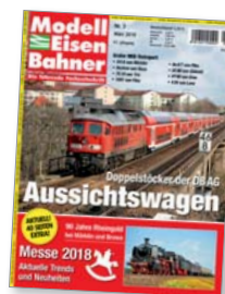
Titel: Überführung neuer Doppelstockwagen.

Mit der Bahnreform war die Geschichte der bei der DB unbekanntem Doppelstockzüge nicht zu Ende. Im Gegenteil: Inzwischen sind sie sogar Teil des Fernverkehrs.