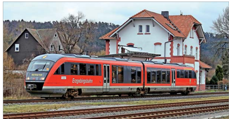
Ebenfalls am 29. Dezember 2017 war 642 200, noch in Beschriftung der Erzgebirgsbahn, nach Brilon Stadt unterwegs, hier in Sarnau Bf.