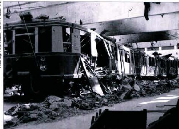
Ein Viertelzug der Peenemünder Werkbahn nach dem Bombenangriff auf das Raketerversuchszentrum 1943.