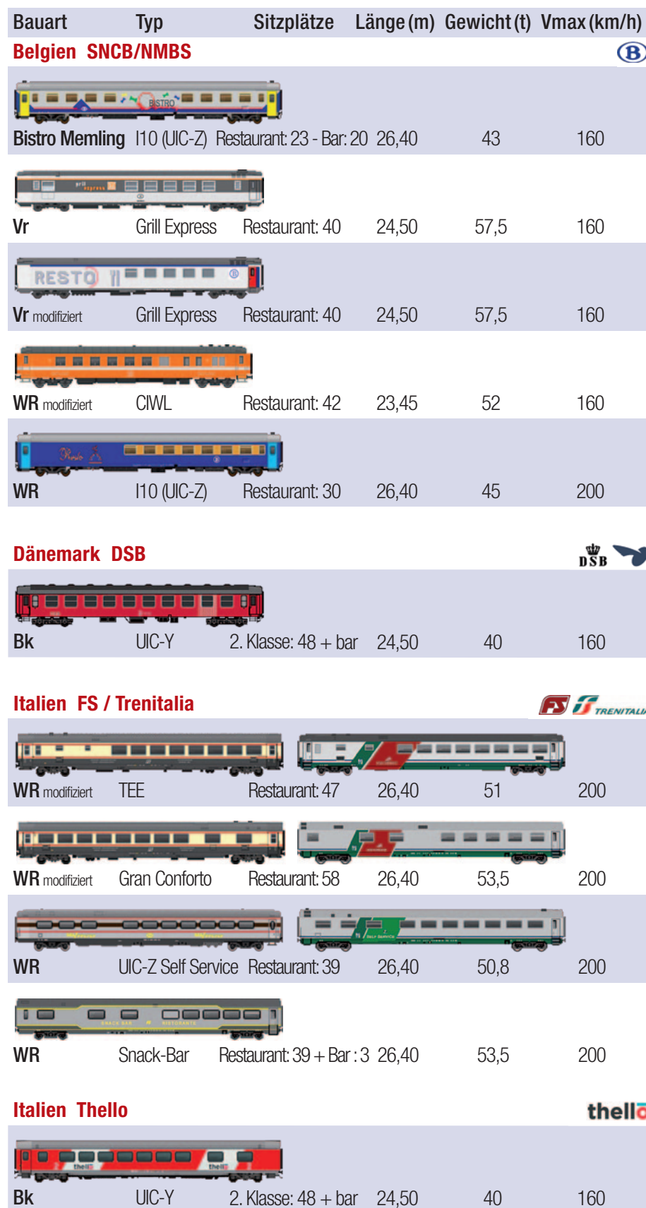
Tabelle 2.12. Speisewagen und Barwagen im EuroCity-Verkehr 1993 - 2020