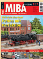
MIBA-Spezial 107 Patina mit Perfektion Best.-Nr. 120 10716