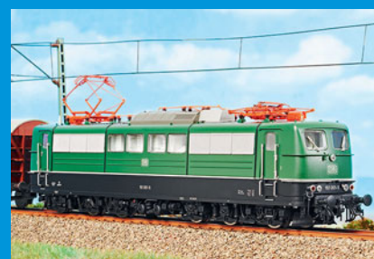
Im MIBA-Test: Die BR 151 in H0 von Piko