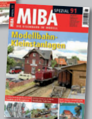
MIBA-Spezial 91 Best.-Nr. 12089112-e