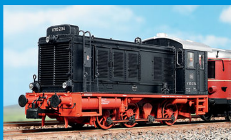
Im MIBA-Test: Brawa-V 36.2 mit vielen Funktionen