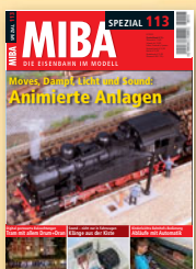
MIBA-Spezial 113 Animierte Anlagen Best.-Nr. 120 11317