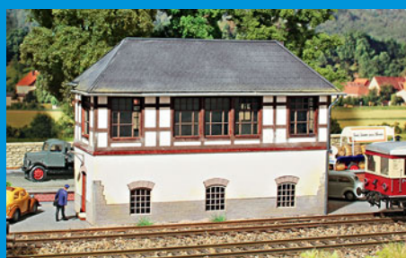
Das Stellwerk von Herdecke als Lasercut-Bausatz