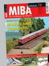
MIBA-Spezial 78 Best.-Nr. 12087808-e