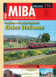
MIBA-Spezial 116 Kleine Stationen Best.-Nr. 120 11618

Jeder Band mit 108 Seiten im DIN-A4-Format und über 180 Abbildungen, je € 12,-