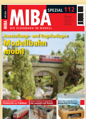
MIBA-Spezial 112 Modellbahn mobil Best.-Nr. 120 11217