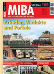
MIBA-Spezial 109 Arkaden, Viadukte und Portale Best.-Nr. 120 10916