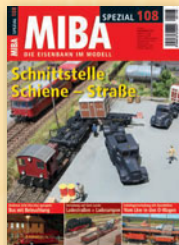
MIBA-Spezial 108 Schnittstelle Schiene – Straße Best.-Nr. 120 10816