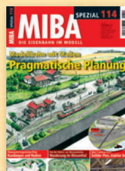
MIBA-Spezial 114 Pragmatische Planung Best.-Nr. 120 11417