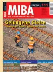
MIBA-Spezial 111 Gelungene Gleise Best.-Nr. 120 11117