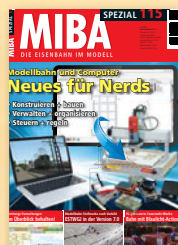
MIBA-Spezial 115 Neues für Nerds Best.-Nr. 120 11518