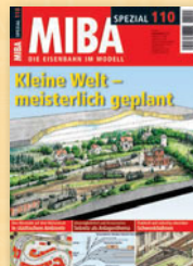
MIBA-Spezial 110 Kleine Welt – meisterlich geplant Best.-Nr. 120 11016