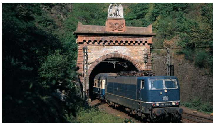
Strukturhistorie: Des Kaisers Tunnel ➔ 12