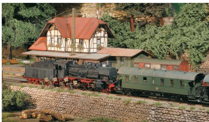
Anlagenporträt: Der Hammer von Köln ➔ 58