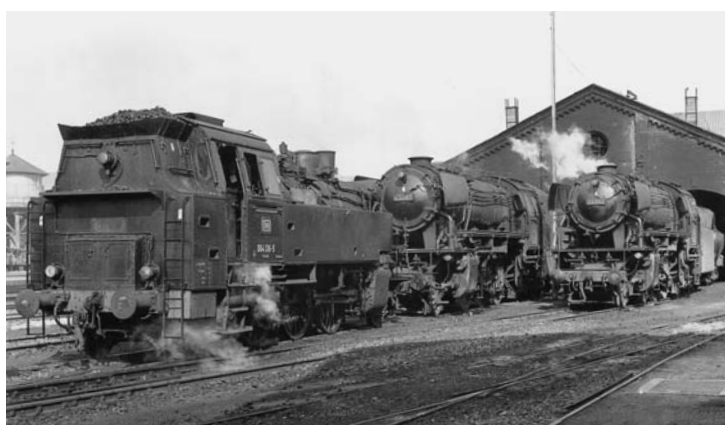
Historische Fototour: Damals in Lauda ➔ 26