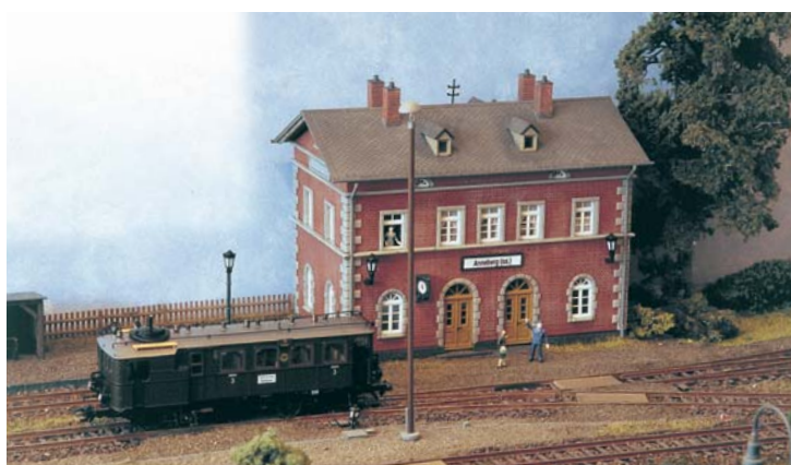
EJ-Modellbauwettbewerb: Die Gewinner-Anlagen ➔ 90

FOTOS: U. KANDLER, J. A. BOCK, H. SCHOLZ, J. KUPPERSCHMIDT; TITEL-FOTO: B. KAISER