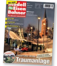
Titel: H0e-Anlage von Christian Voigt

Zahnradbahnen sind technische Meisterleistungen, spektakulär sind sie ebenfalls. Um auf den jeweiligen Gipfel zu gelangen, nutzten die Ingenieure verschiedene Systeme.