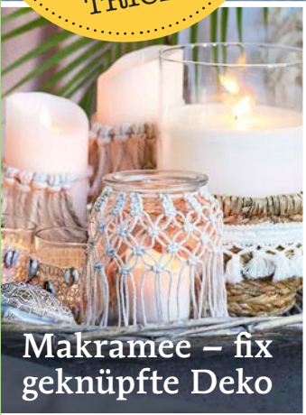
Makramée – fix geknüpft Deko