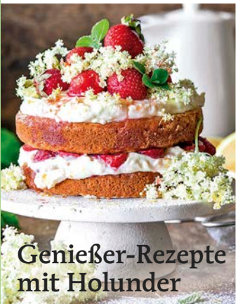
Genießer-Rezepte mit Holunder