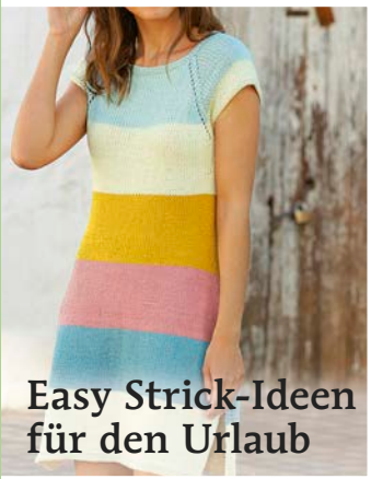
Easy Strick-Ideen für den Urlaub