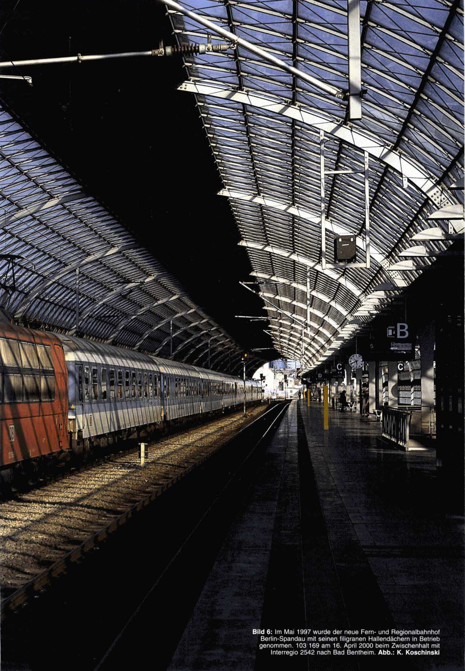
Bild 6: Im Mai 1997 wurde der neue Fern- und Regionalbahnhof Berlin-Spandau mit seinen filigranen Hallendächern in Betrieb genommen. 103 169 am 16. April 2000 beim Zwischenhalt mit Interregio 2542 nach Bad Bentheim.