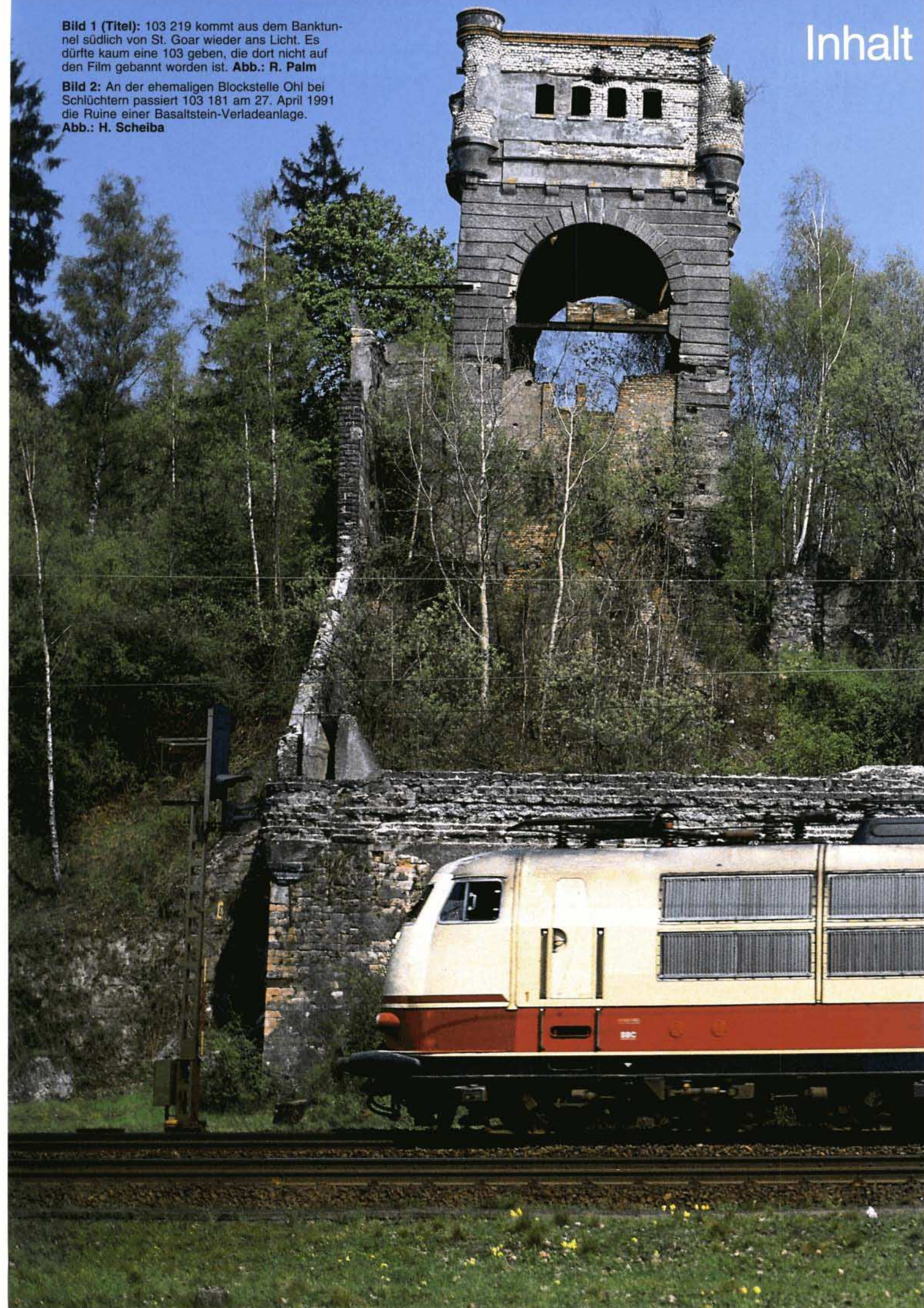
Bild 2: An der ehemaligen Blockstelle Ohl bei Schlüchtern passiert 103 181 am 27. April 1991 die Ruine einer Basaltstein-Verladeanlage.

Bild 1 (Titel): 103 219 kommt aus dem Banktunnel südlich von St. Goar wieder ans Licht. Es dürfte kaum eine 103 geben, die dort nicht auf den Film gebannt worden ist.