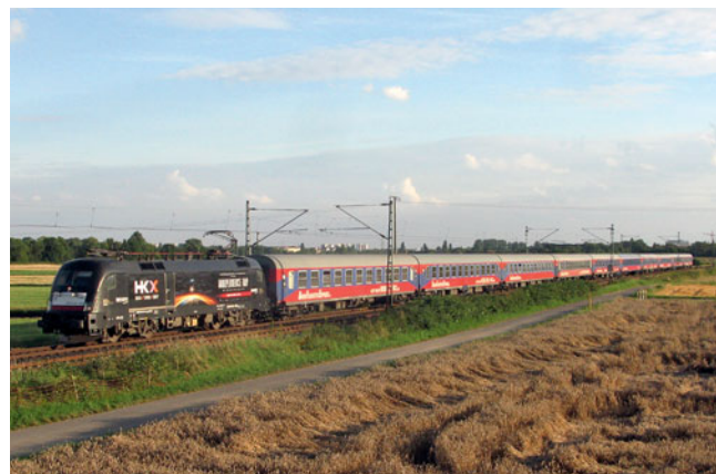
Die Mietlok ES64 U2 036 „Independence Day“ zieht den HKX am 1. August 2016 im Abendlicht bei Flörsheim durch die Mainebene nach Frankfurt (Main).

Nach nur einem Dreivierteljahr hat der Hamburg-Köln-Express (HKX) die Verbindung nach Frankfurt (Main) zum 29. August wieder eingestellt. Seit Dezember 2015 konnte Frankfurt freitags und montags gegen 20 Uhr mit dem HKX erreicht werden, donnerstags und an Samstagen lief die Garnitur in der Gegenrichtung nach Köln und dann weiter nach Hamburg. Die Verbindung durch das Mittelrheintal stellte eine wunderbare Reminiszenz an die klassischen D-Züge dar, konnte doch im gepflegten Abteilwagen mit klassischen Übersetzfenstern Platz genommen werden – für 12 Euro. HKX konzentriert sich nun wieder auf seine klassische Verbindung Köln – Hamburg. HS