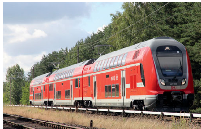
Auf der Front sind bei diesem Zug jetzt die „gewohnten“ Triebwagennummern 445 009 und 010 zu lesen: zwei Twindexx-Motorwagen mit Mittelwagen in Hennigsdorf (15. August 2016).