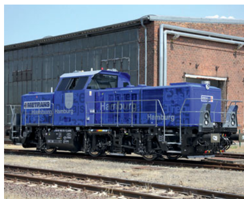
Alstom in Stendal hat die erste Hybrid-H3 an Metrans übergeben. Eine zweite Lok kommt im Laufe des zweiten Halbjahrs 2016.

Die Metrans Rail (Deutschland) GmbH, Tochtergesellschaft der Hamburger Hafen und Logistik AG (HHLA), bedient nicht nur die Relation Hamburg – Tschechien mit den TRAXX-Mehrsystemloks der Reihe 386, sondern ist im Hamburger Hafen auch mit Rangierloks (ehemalige DB-295er) aktiv. Wegen des steigenden Rangieraufkommens hat Metrans Anfang des Jahres bei Alstom zwei Rangierloks vom Typ H3 in Hybrid-Ausführung bestellt, von denen die erste am 21. Juli im Alstom-Werk Stendal offiziell übergeben wurde. Neben einem 350 kW starken Dieselgenerator ist die dreiachsige Hybrid-H3 mit einem NiCd-Akkumulator ausgestattet und fährt je nach Einsatz zwischen 50 und 70 Prozent ihrer Betriebsdauer im Batteriebetrieb, wodurch bis zu 50 Prozent CO 2 und bis zu 70 Prozent sonstige Schadstoffemissionen wie z.B. Stickstoffdioxid eingespart werden. Die 12,8 Meter lange Lok ist 67,5 Tonnen schwer und 100 km/h schnell. jhö