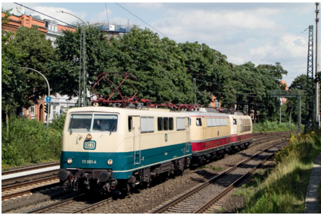
Von der 111 001 wurde die E 03 001 zusammen mit der Serienmaschine 103 235 nach Hamburg-Eidelstedt überführt. Dort sollen weitere Kosten für eine erneute Revision geprüft werden.