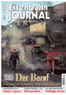
TITELFOTO VORBILD: FRIEDRICH WILHELM BAUER