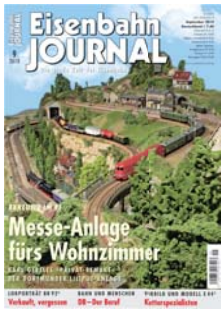
TITELFOTO MODELL: KARL GEBELE

Diese EJ-Ausgabe wird in Teilaufgaben mit unterschiedlichen Titelbildern ausgeliefert.