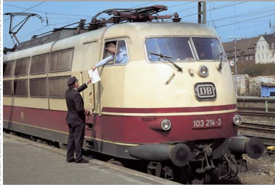
Eisenbahn-Zeitgeschichte DB – Der Beruf