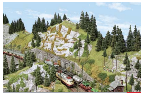
Anlagenporträt Auslauf für die Sammlung

Artikelbenotung 2010 Teilnehmen und eine BR 044 von Roco gewinnen. Siehe Seite 11.