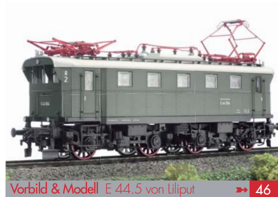
Vorbild & Modell E 44.5 von Liliput