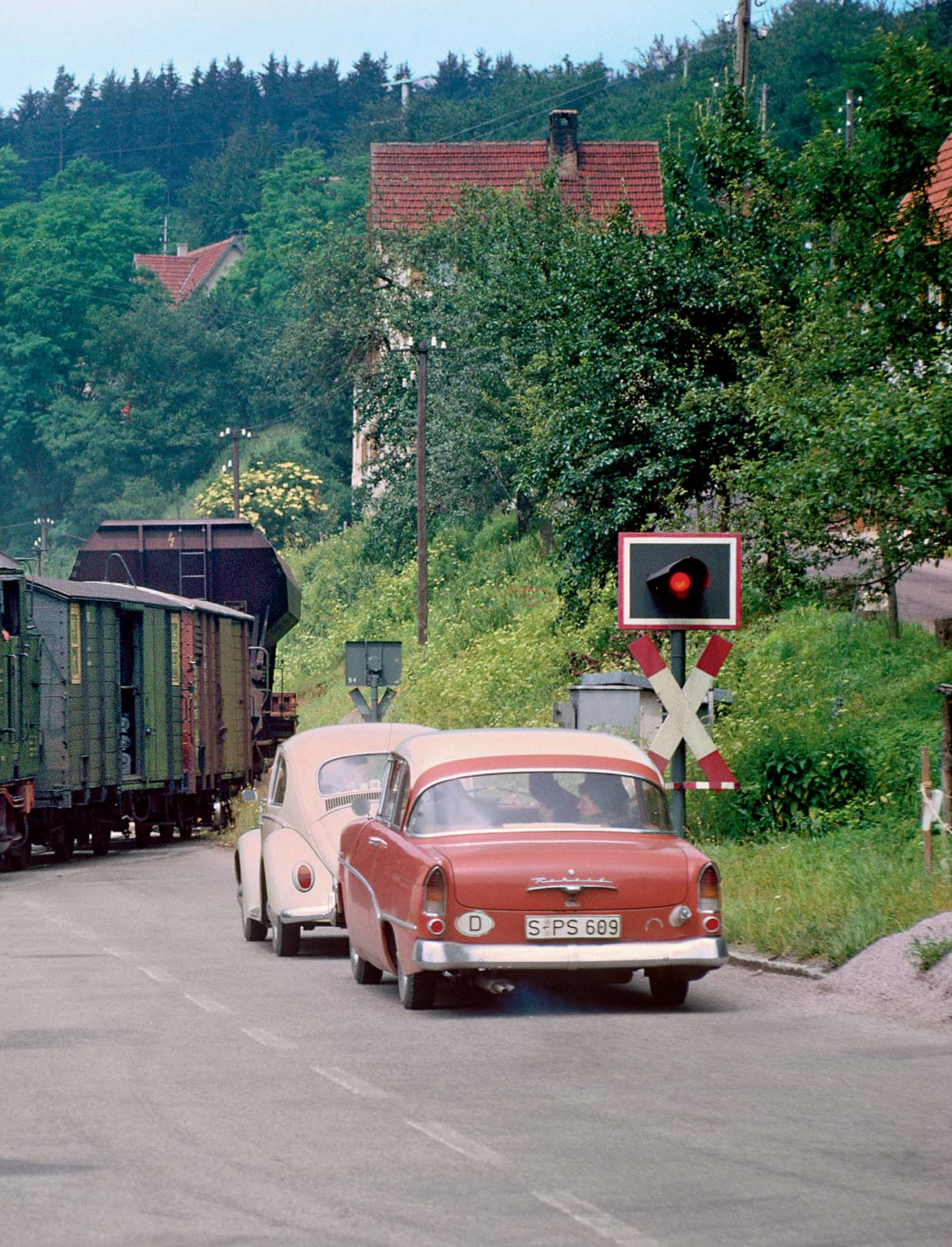
Das sparsame Schwaben-Ländle war einst ein richtiges Schmalspur-Paradies. Besonders idyllisch war die Strecke Nagold – Altensteig. Trotz massiver Proteste endete der Personenverkehr auf dem 750-Millimeter-Bähnle bereits 1962, fünf Jahre später wurde auch der Güterverkehr eingestellt. Im Juni 1965 passiert hier die 99 193 den Bahnübergang in Ebhausen. Mindestens ebenso sehenswert sind die wartenden zeitgenössischen Automobile.