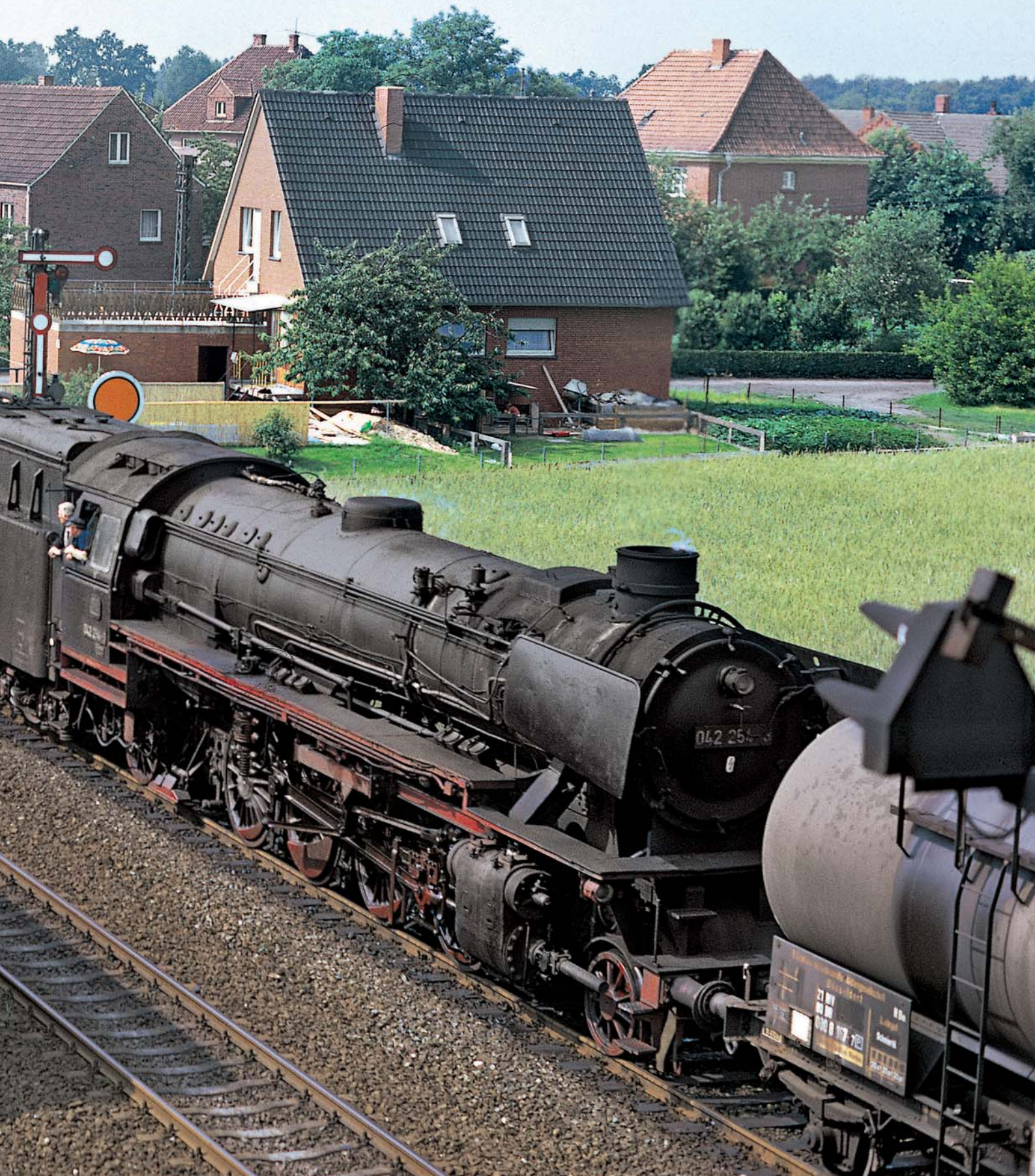
Drei Jahre vor dem Dampf-Ende bei der Bundesbahn waren Dampfzüge auf der Emslandstrecke im Güterzugdienst zwar noch unentbehrlich und bespannten sogar noch doppelt die legendären 4000-Tonnen-Erzzüge Richtung Ruhrgebiet. Mitunter kam es da aber bereits zu einem Dampf-Diesel-Doppel, wie hier im Juni 1974 in Salzbergen, als die 216 040 der 44er dahinter klarmachte, wo es langgeht: Die Dieselloks waren im Kommen!