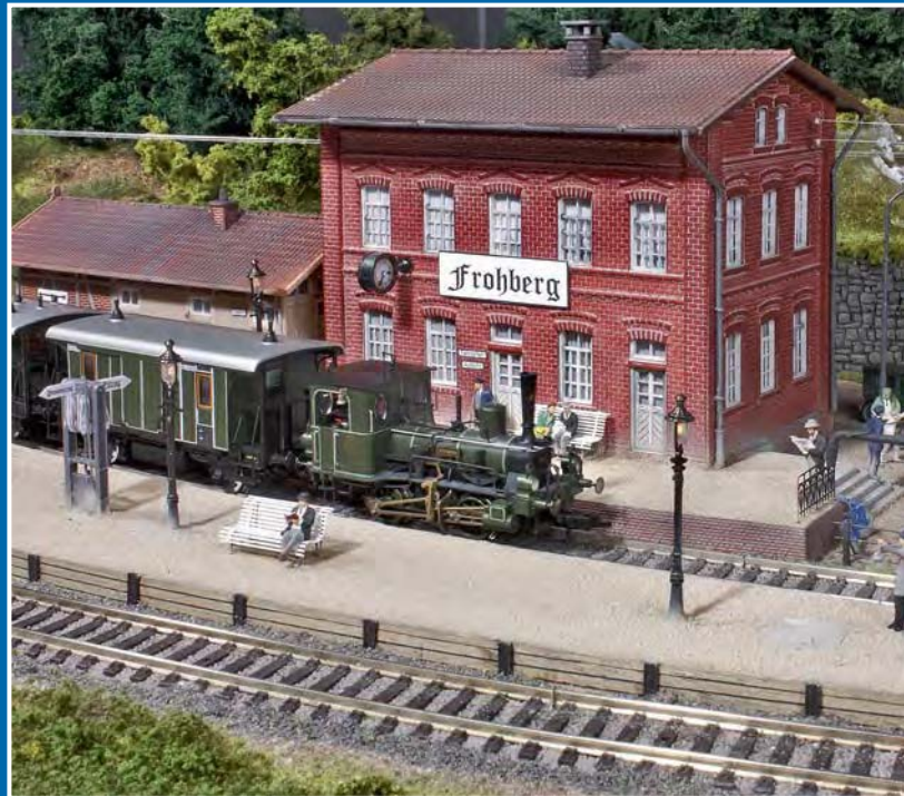
Einer überdimensionalen Geschenkverpackung anlässlich „125 Jahre Fleischmann“ entstieg regelmäßig die überschaubare H0-Anlage „Frohberg“ in Zimmergröße mit verschängelter Gleisführung und sorgte durch ihre herausragenden Motiven für einen echten Messehingucker.