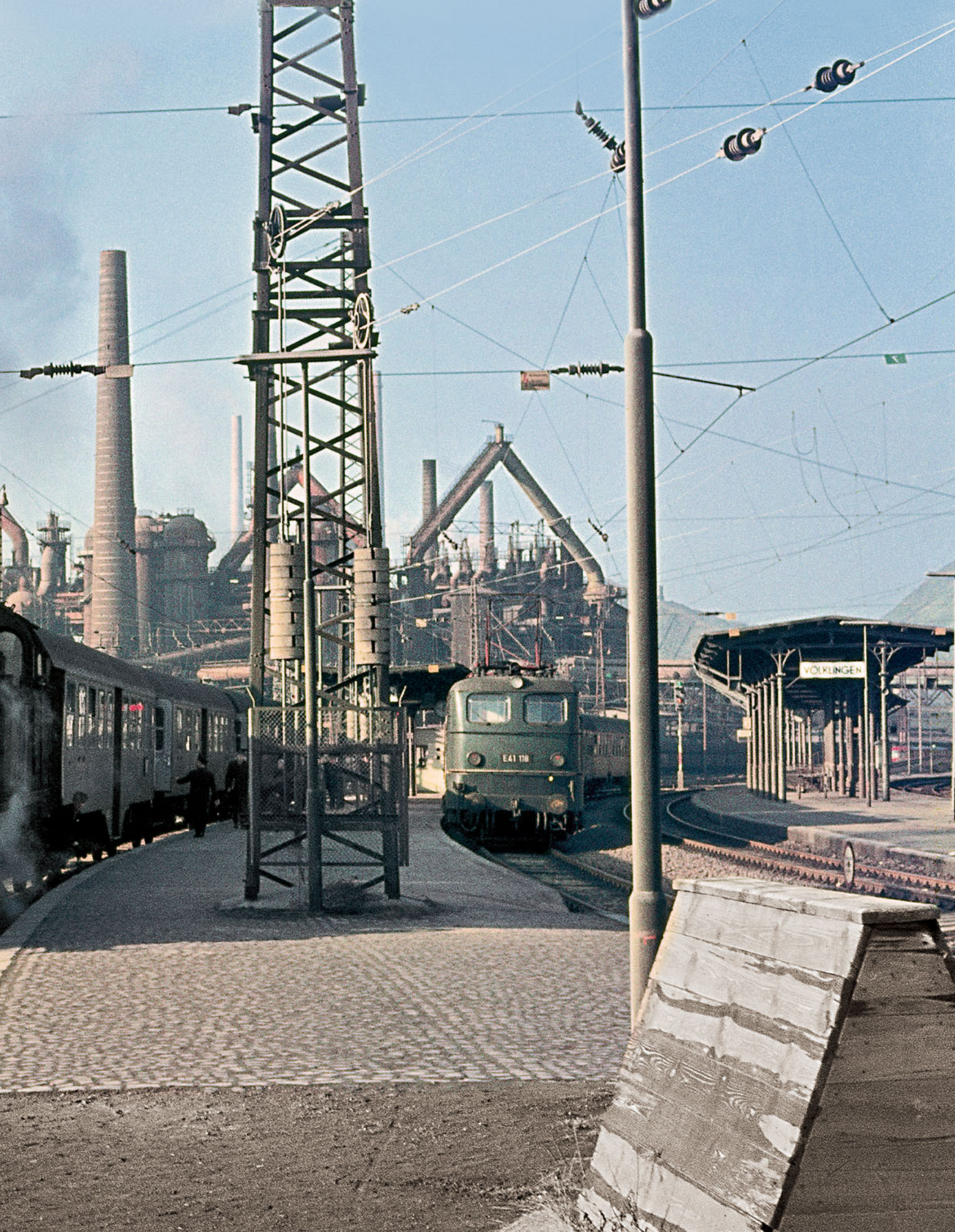
Weil in der vorigen Ausgabe im Beitrag über den Dampflokeinsatz im Saarland für dieses charakteristische Motiv kein gebührender Platz mehr vorhanden war, reichen wir es hiermit nach: Vor typischer Industriekulisse steht die 78 324 mit P 2155 am 20. Januar 1968 abfahrbereit im Völklinger Bahnhof. Daneben ebenfalls mit Personenzug eine E 41.