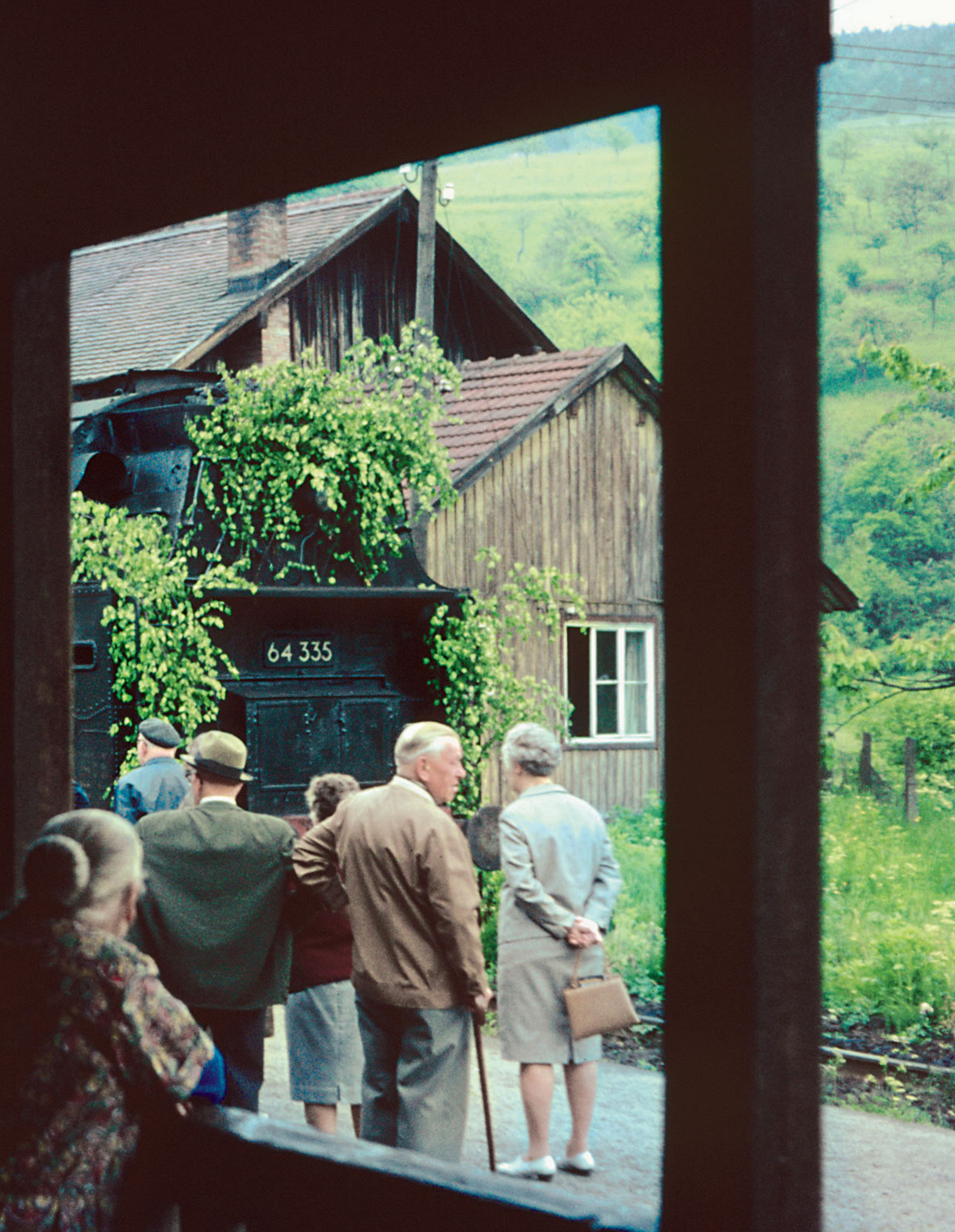
Wo war die jüngere Bevölkerung, als die 64 335 am 25. Mai 1968 in Heimbuchenthal zur letzten Personenzugfahrt nach Obernburg-Elsfeld aufbrach? Offenbar empfanden die Älteren des Ortes mehr Verbundenheit mit der 1914 eröffneten Bahn durchs Elsavatal im Spessart. Mit dem Züglein verschwand ein gewohnter Teil des Alltagslebens.