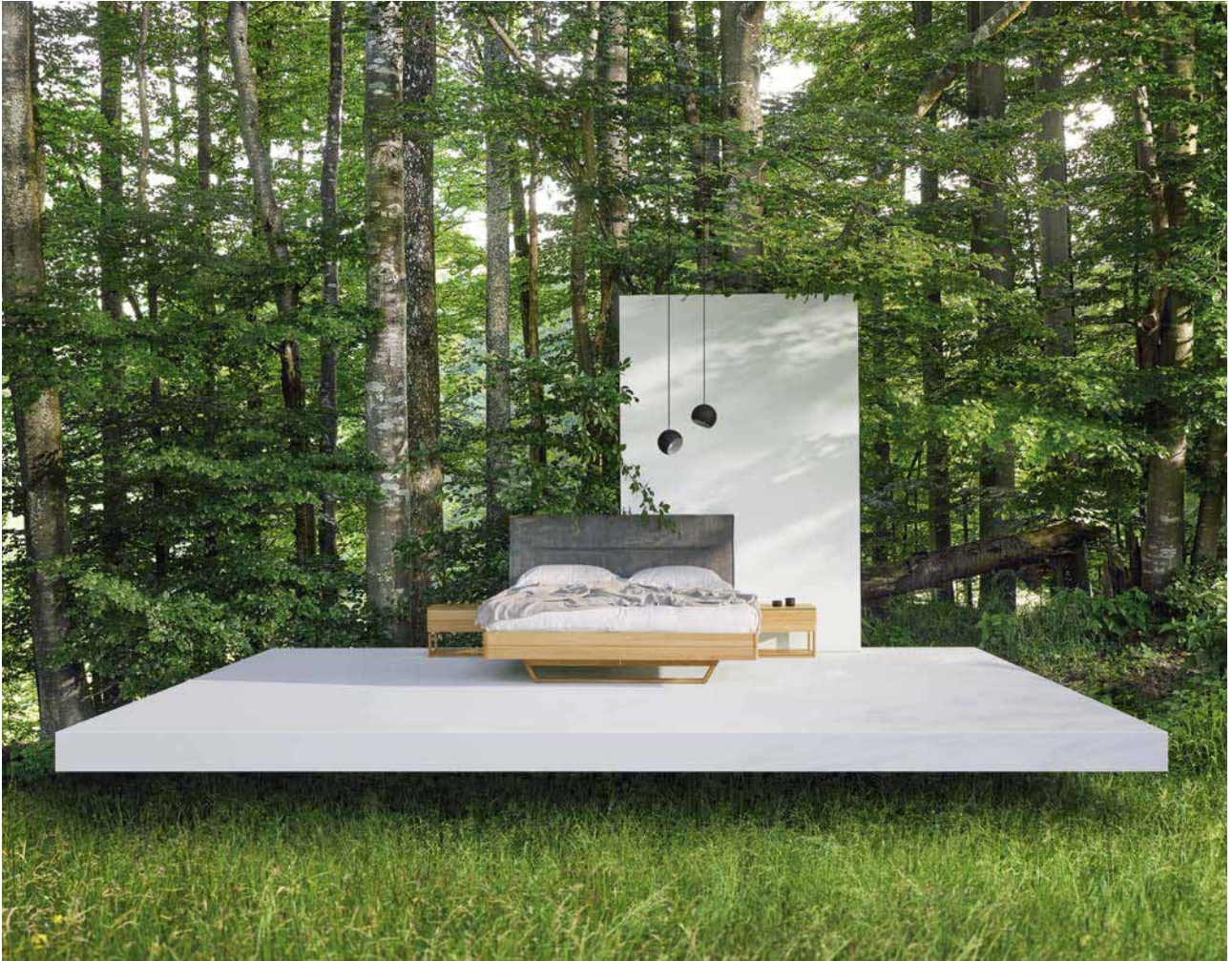
float. Das grüne Bett.