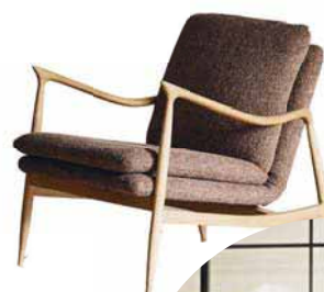
Designtradition fortschreiben: Sessel „Oak“, ca. 3.160 Euro (Kaerly)

Kommode „June“ in „Ocean Purple“, 100x80x45 cm, ca. 980 Euro (Zuiver)