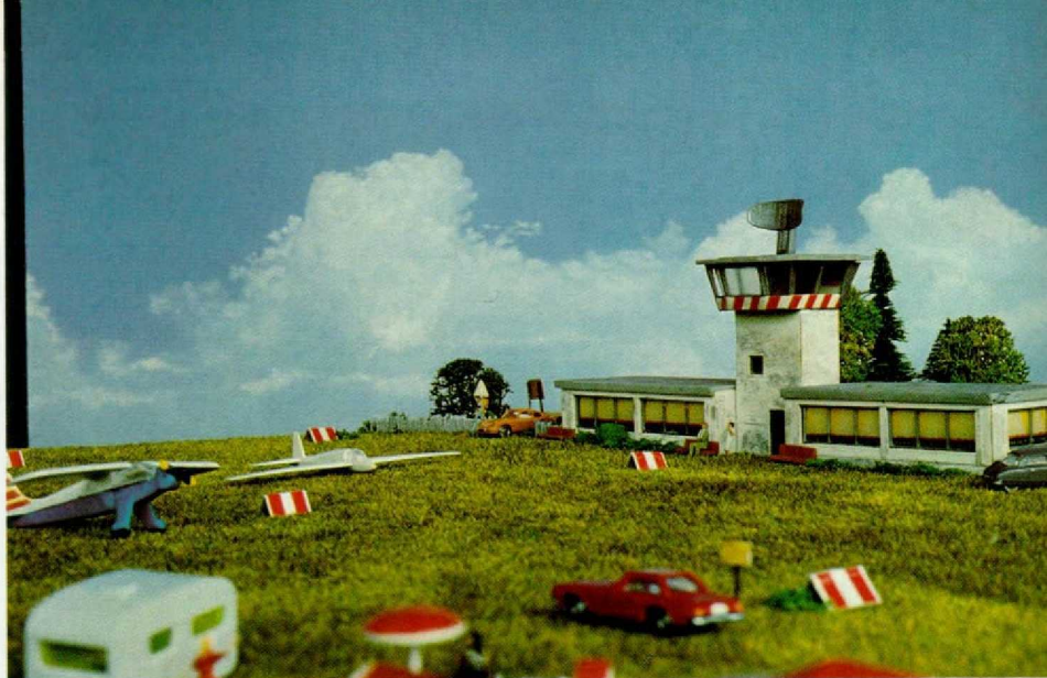
Abb. 2. Während die „tollkühnen Männer in ihren fliegenden Kisten“ die Lüfte unsicher machen, amüsieren sich die Fliegerfrauen am Rande der Piste über die Flugkünste ihrer besseren Hälften.

Abb. 1. Der kleine Sportflugplatz hat einen relativ großen Tower. Im Moment wird gerade ein Segelflugzeug mit der Motorwinde hochgezogen.