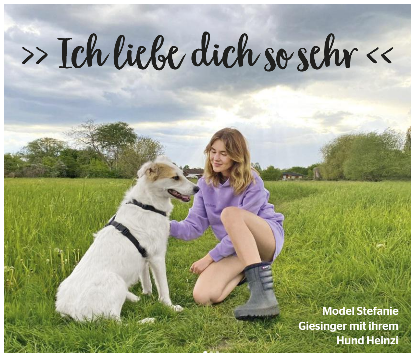
Model Stefanie Giesinger mit ihrem Hund Heinzl