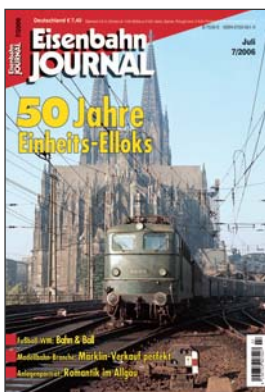
TITELBILD: Von Mitte der 1950er Jahre an bildeten E 10, E 40, E 41 und E 50 über einen langen Zeitraum das Rückgrat der elek-trischen Traktion bei der Bundesbahn. Unser Beitrag zum 50-jährigen Jubiläum porträtiert die Einheitselloks noch einmal in allen Facetten – ab Seite 12!