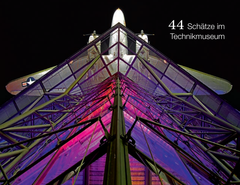
44 Schätze im Technikmuseum