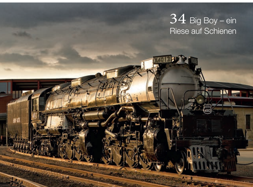
34 Big Boy – ein Riese auf Schienen