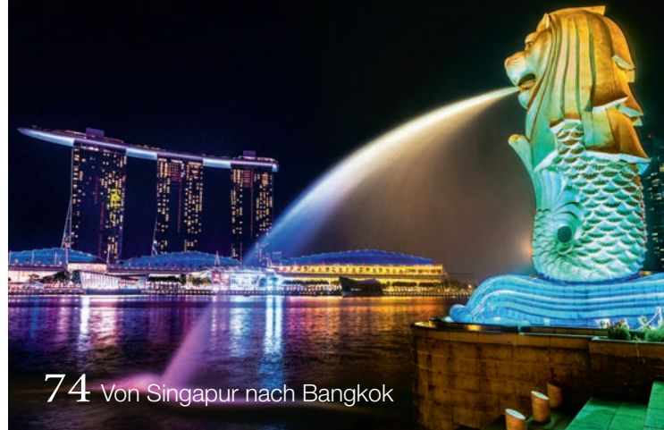
74 Von Singapur nach Bangkok