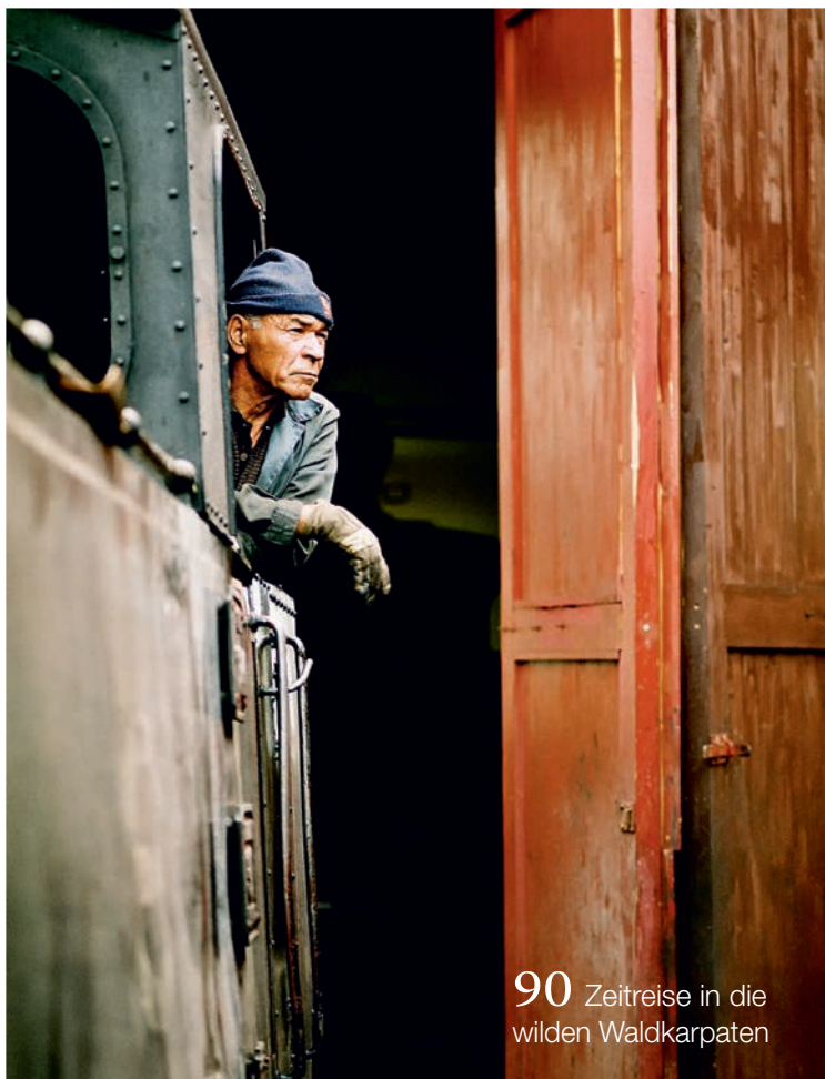
90 Zeitreise in die wilden Waldkarpaten