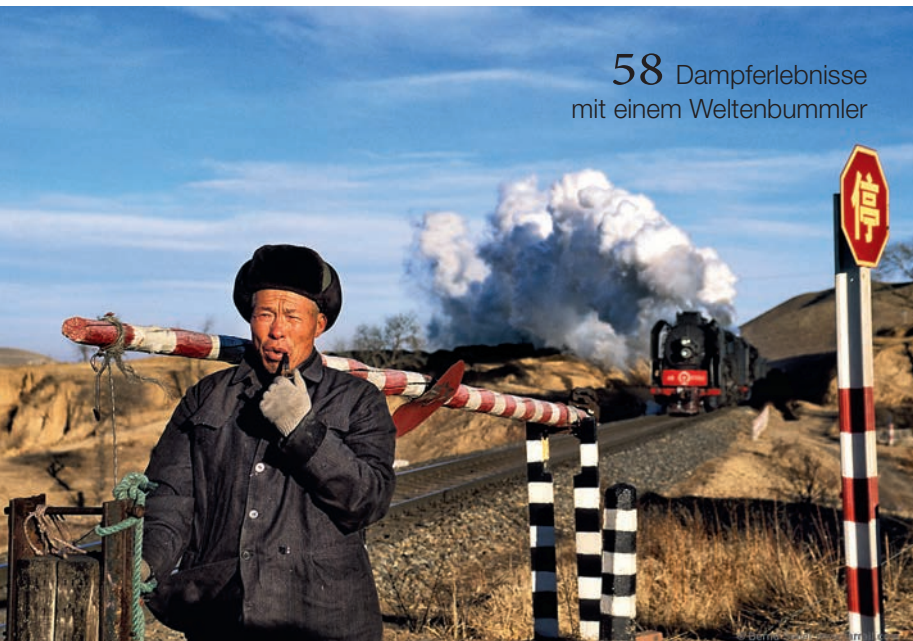
58 Dampferlebnisse mit einem Weltenbummler