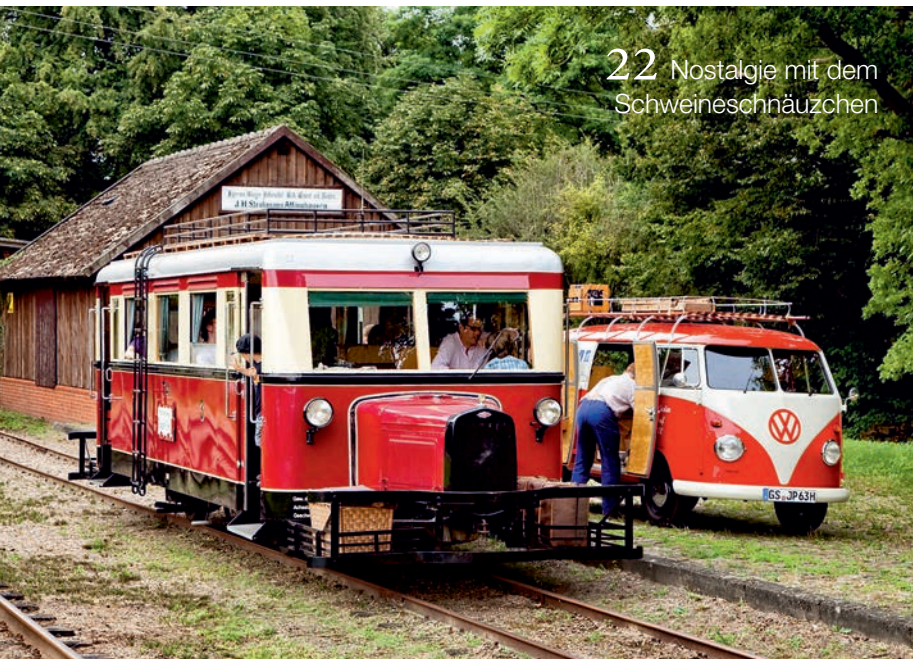
22 Nostalgie mit dem Schweineschnäuzchen