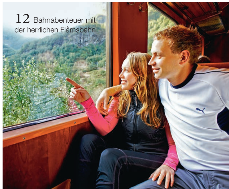
12 Bahnabenteuer mit der herrlichen Flåmsbahn