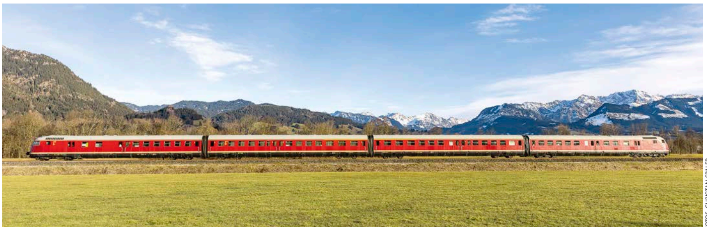
Die Alpen im Hintergrund und der Zug in seiner ganzen Länge – bei Blaichach kurz hinter Immenstadt gelang diese Aufnahme.

te der Zug dann auf die klassische Allgäubahn ab. Bis Röthenbach/Allgäu arbeiteten sich die Fotografen gemeinsam mit dem Stuttgarter Rössle entlang der zahlreichen Fotomotive im Allgäu voran. Auch wenn an diesem Wochenende leider kein Schnee mehr lag, entschädigte das insgesamt sehr schöne Wetter. In Röthenbach machte der Zug Kopf und es ging zurück am Alsee vorbei bis Immenstadt. Dort zweigte die markante Garnitur auf die Stichbahn nach Oberstdorf ab. Ab hier prägten mehr und mehr die Allgäuer Alpen das Umfeld des Zuges und rückten in den Fokus der Fotografen. Bis zum geplanten Ende um 18 Uhr war der VT 12.5 ein zuverlässiger Begleiter und bescherte den zahlenden Fotografen einen mehr als kurzweiligen Tag mit vielen Glücksmomenten.