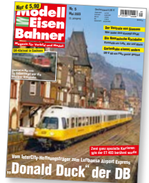
Titel: 403 001 und 002 am 1. April 1982 als LH1003 bei Bacharach.

Mit der Schnelltriebwagen-Baureihe 403 wollte die Deutsche Bundesbahn vor 50 Jahren ein besonders wirtschaftliches Fahrzeug für den neuen Intercity-Fernverkehr beschaffen. Es reichte dann zwar nur für drei Garnituren, doch deren spätere Verwendung als unvergessener „Lufthansa Airport Express“ sorgte dafür, dass der 403 trotzdem zur Eisenbahn-Legende wurde.