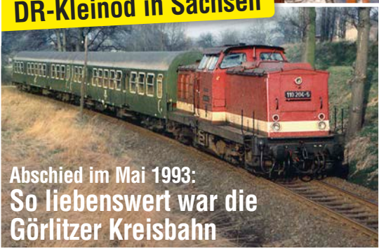
Abschied im Mai 1993: So liebenswert war die Görlitzer Kreisbahn