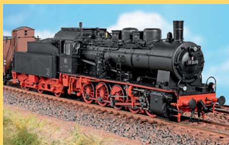
Die Baureihe 57 10-35 von Brawa im MIBA-Test