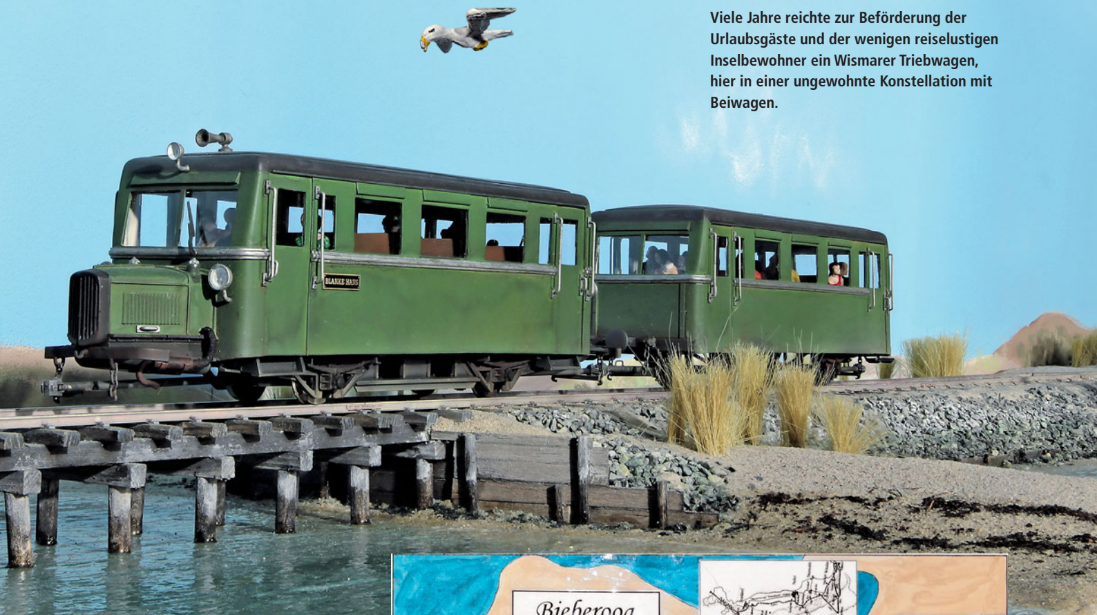
Viele Jahre reichte zur Beförderung der Urlaubsgäste und der wenigen reiselustigen Inselbewohner ein Wismarer Triebwagen, hier in einer ungewohnte Konstellation mit Beiwagen.

erworben wurde, ausreichen, um das Transportaufkommen zu bewältigen.