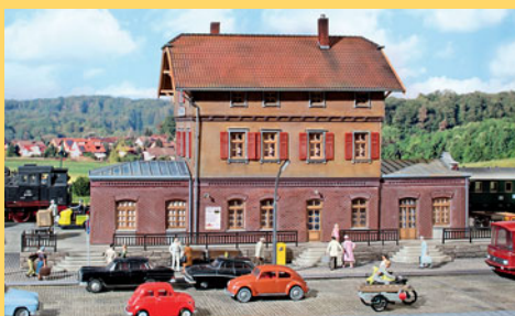
Bahnhof „Steinheim“ von Faller in 1:87