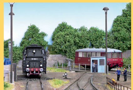
Lokbahnhof mit Schwenkbühne