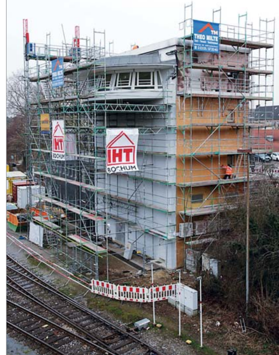
Noch stehen die Gerüste. Das Stellwerk Mülheim-Styrum, ein Herz des Ruhrgebietsverkehrs, wurde in Windeseile rekonstruiert.

Betrieb der Anlage aus. Die Bahn setzte in dieser Zeit Ersatzbusse ein. Die Wiederinbetriebnahme ermöglichte auch, dass der Hochgeschwindigkeitszug Thalys seitdem von Dortmund aus nach Paris verkehrt. Die geplante Verlängerung der Verbindung über Essen hinaus war wegen des Brandes im Mülheimer Stellwerk um Monate verschoben worden.