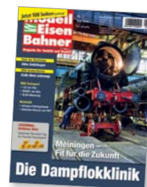
Titel: 95 027 im Dampflokerk Meiningen

Um den Fortbestand des Dampflokerks langfristig zu sichern, gibt es in Meiningen große Pläne.