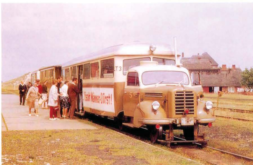
Bild 4. Als dieses Bild von Erich Rockelmann um 1963 im Bf List aufgenommen wurde, war die meterspurige Sylter Inselbahn bereits als Straßenbahn umkonzessioniert worden. Die kuriosen, auf Borgward LKW-Basis entstandenen Leichttriebwagen mußten übrigens an den Streckenendpunkten auf einer Drehscheibe gewendet werden.