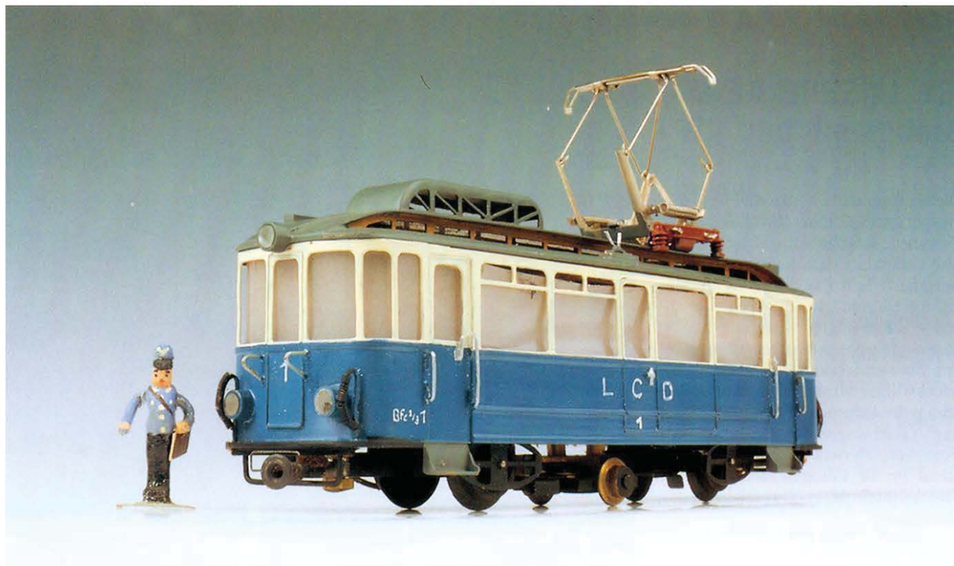
Bild 1. Der Triebwagen BFe 2/3 Nr. 1 der Locarno–Domodossola-Straßenbahn (LCD). Bei diesem Modell steht ein historisches Preiser-Figürchen noch aus Holz.

Um diese Fahrwerke herum mußten die Aufbauten dementsprechend angepaßt werden. Die Gehäuse wurden aus Messing nach Zeichnungsvorlagen, die man selbst angefertigt hat – zuerst wurde eine ungefähr maßstäbliche Zeichnung ausgeschnitten und auf Messingblech aufgeklebt – mühevoll mit Laubsäge ausgearbeitet. Mit Nadelfeilen wurden die groben Sägestellen verfeinert. Extra aufgesetzte Zierstreifen, die um den Wagenkasten verlegt wurden, mußten aus dünnen Messing-Streifen ausgeschnitten, dann vorsichtig gebogen und später verlötet werden. Ein Arbeitsvorgang, den man heute mit neuen Mitteln anders lösen würde.