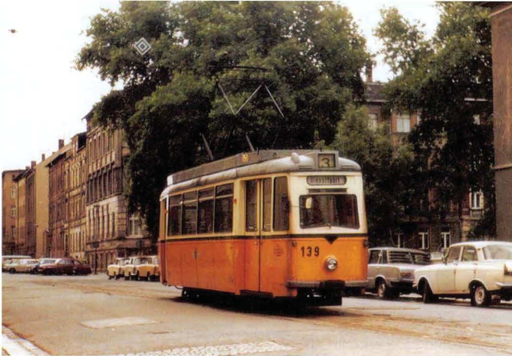
Bild 1. Kein Zweifel – dieses im September 1986 von Jürgen Groh in Gera aufgenommene Foto zeigt eine „echte“ meterspurige Straßenbahn.