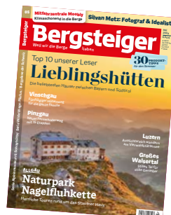
Cover: Das Watzmannhaus im Morgenlicht, Foto: Adobe Stock