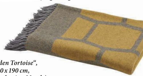
Webdecke „Golden Tortoise“, Yak/Merino, 120 x 190 cm, ca. 264 Euro (Catharina Mende)

Es geht sowohl um den dekorativen Aspekt als auch um die Haptik. Beim Onlinekauf kann das zur Herausforderung werden. Daher ist es umso wichtiger, auf das Material zu achten. Man sollte sich darauf einstellen, dass gute Qualität und Naturmaterialien ihren Preis haben. Ich persönlich würde ebenso darauf Wert legen, dass die Stücke in Europa gefertigt werden.