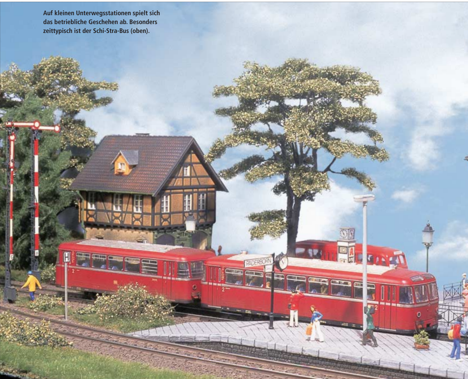
Auf kleinen Unterwegsstationen spielt sich das betriebliche Geschehen ab. Besonders zeittypisch ist der Schi-Stra-Bus (oben).

Ein Großteil der Gebäude ist im Eigenbau bzw. als Umbau auf der Basis von Industriemodellen entstanden. Individuelle Farbgebung und leichte Spuren der Verwitterung sorgen bei allen Gebäuden und Fahrzeugen für einen stimmigen und realistischen Eindruck. Laubbäume entstanden aus Heki-Bausätzen oder im Eigenbau (Litzen-draht verdrillt und verlötet). Kiefern