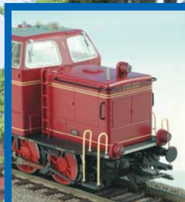
V 65 von Roco im MIBA-Test: S. 36