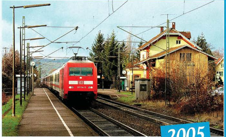
An einem schönen Dezembertag passiert 101134 an der Spitze eines Eurocitys den hübschen Bahnhof Eimeldingen.

Der Eimeldinger Bahnhof liegt an einer Strecke, die bereits vor 170 Jahren per Landtagsbeschluss (29. März 1838) projektiert wurde: „Von Mannheim über Heidelberg, (...) und Freiburg bis zur Schweizer Grenze bei Basel wird eine Eisenbahn erbaut, (...)“ Freiburg wurde 1845 erreicht, 1848 Efringen und 1851 Haltingen. Dazwischen liegt Eimeldingen. Gebaut wurde anfangs in badischer Breitspur.