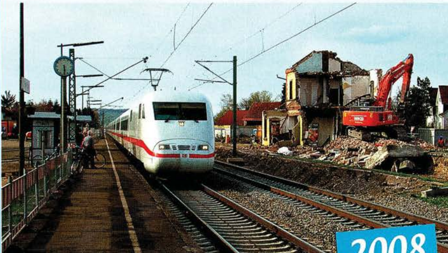
Vom gut erhaltenen Bahnhof bleibt nichts übrig. Er steht dem wachsenden transeuropäischen Verkehr im Weg.

Das Bahnhofsgebäude in Eimeldingen wurde dem stetig wachsenden Verkehr auf einer der befahrensten Eisenbahnrouen Europas, der Verbindung zwischen Italien sowie der Schweiz und den Nordseehäfen in Rotterdam und Antwerpen, geopfert und ist nun Geschichte: Zuerst wurde der Bahnsteig aus dem Bereich des Gebäudes in nördliche Richtung verlegt. Zwei Fahrleitungsmasten mussten näher an der Gleistrasse platziert werden. Im Inneren des Gebäudes dauerte die Vorbereitung zum Abriss etwas länger als geplant. So wurde das Gebäude erst Anfang April, dann jedoch innerhalb weniger Tage dem Erdboden gleich gemacht. Auch die andere Gleisseite wird umgestaltet. Hier laufen Arbeiten zum Errichten einer Schallschutzwand.