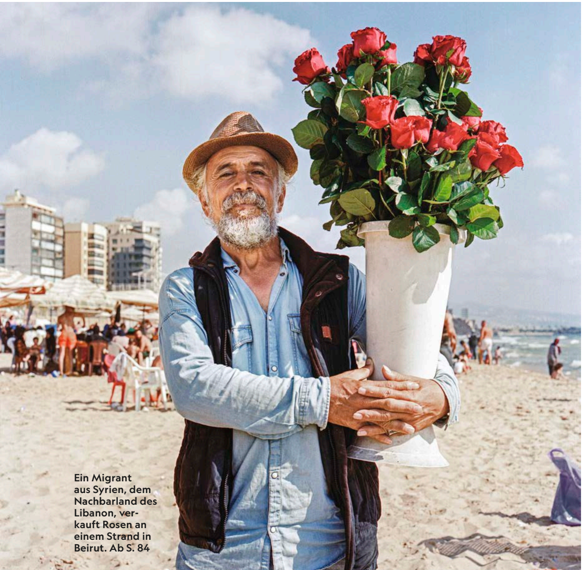
Ein Migrant aus Syrien, dem Nachbarland des Libanon, verkauft Rosen an einem Strand in Beirut. Ab S. 84