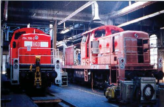
294708 wartet am 30. Juli 2002 im Chemnitzer Anheizschuppen neben 290706 auf ihre Abnahmefahrt.

● Derzeit werden im Aw Chemnitz Maschinen der Baureihe 290 modernisiert. Die um den Wert 500 erhöhte Ordnungsnummer kennzeichnet anschließend die aufgearbeiteten schweren Dieselloks als generalüberholt mit neuem Motor und neuem Umlaufgitter. Nicht alle 290, die sich diesem Programm unterziehen, erhalten eine Funkfernsteuerung.