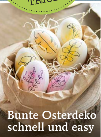
Bunte Osterdeko schnell und easy