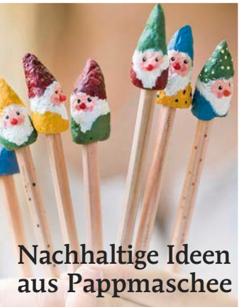
Nachhaltige Ideen aus Pappmaschee