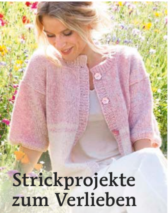
Strickprojekte zum Verlieben