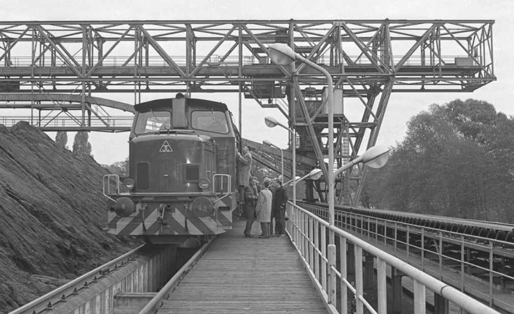
Viele Kraftwerke und Industriebetriebe investierten während der 1960er-Jahre in ihre Infrastruktur, um kostengünstige Ganzzüge entladen zu können. Im Westberliner Stadtteil Spandau besaß das Kraftwerk Oberhavel einen Tiefbunker mit großer Krananlage. Die Züge wurden von der Osthavelländischen Eisenbahn AG im Nachlauf gefahren, die in den 1960er-Jahren in neue Loks investierte.

oder zwischen Chemieparks oder die Versorgung von Industriebetrieben aus den Häfen sind heute das Standbein der Eisenbahn. Auch Baustoff- oder Kohleverkehre finden zwischen solchen Produzenten und Empfängern statt, die große Mengen aufnehmen können. Wachstum findet im Ganzzugverkehr und