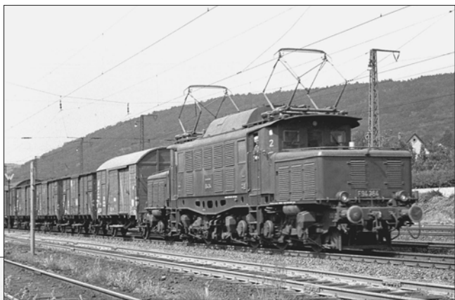
In der Epoche III fand aber auch großflächig der Traktionswandel statt, der bei der Elektrotraktion zunächst mit Altbau-Elloks erfolgte. E 94 264 zieht hier in Gemünden einen gemischten Zug. Am 21. August 1958 war auch das Normalität.

Das Güterverkehrswachstum auf der Straße ist durch kleinteilige Sendungen – teils online bestellte Pakete – geprägt,