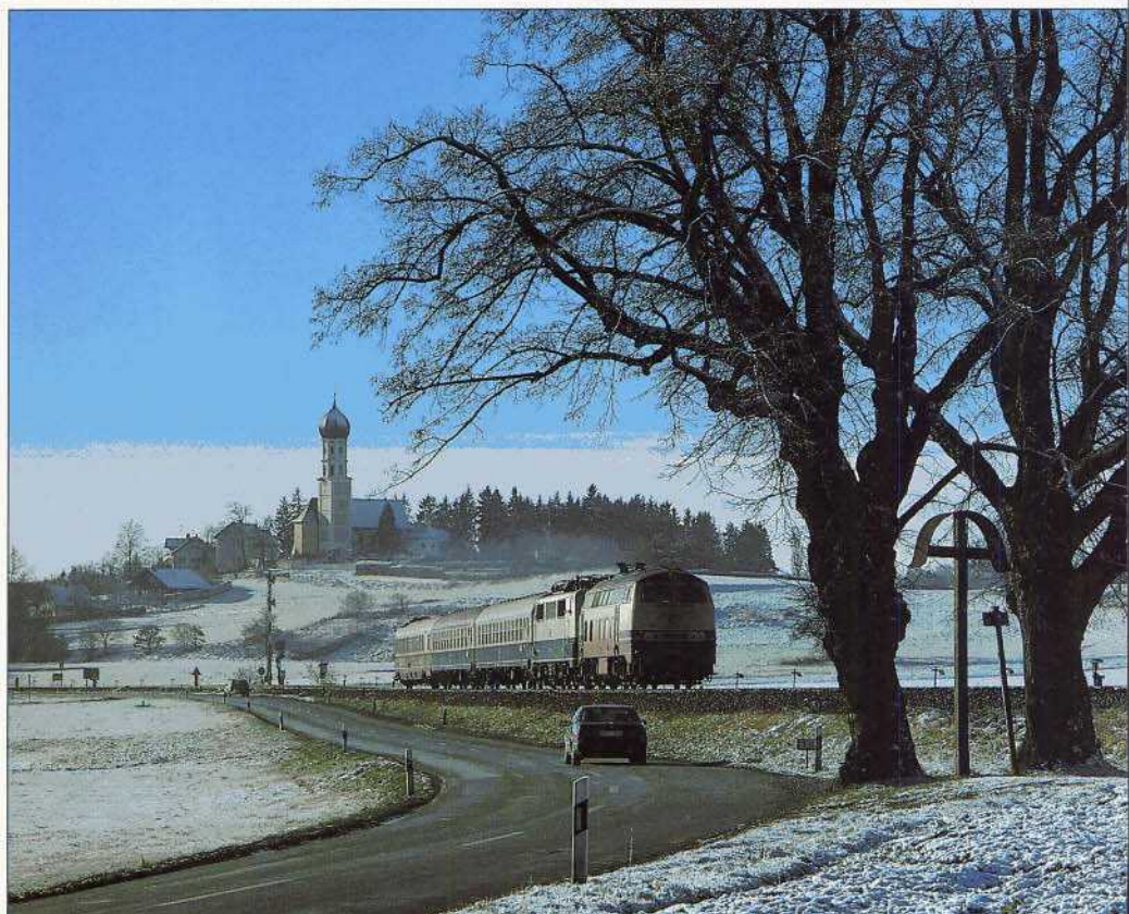
Bild 11 (rechts): Auf dem nichtelektrifizierten Abschnitt Geltendorf – Weilheim seines Laufwegs nach Mittenwald führte der FD AMMERSEE stets die E-Lok mit; hier FD 1918 mit 111 225 hinter 218 449 am 24. November 1989 bei Schondorf.