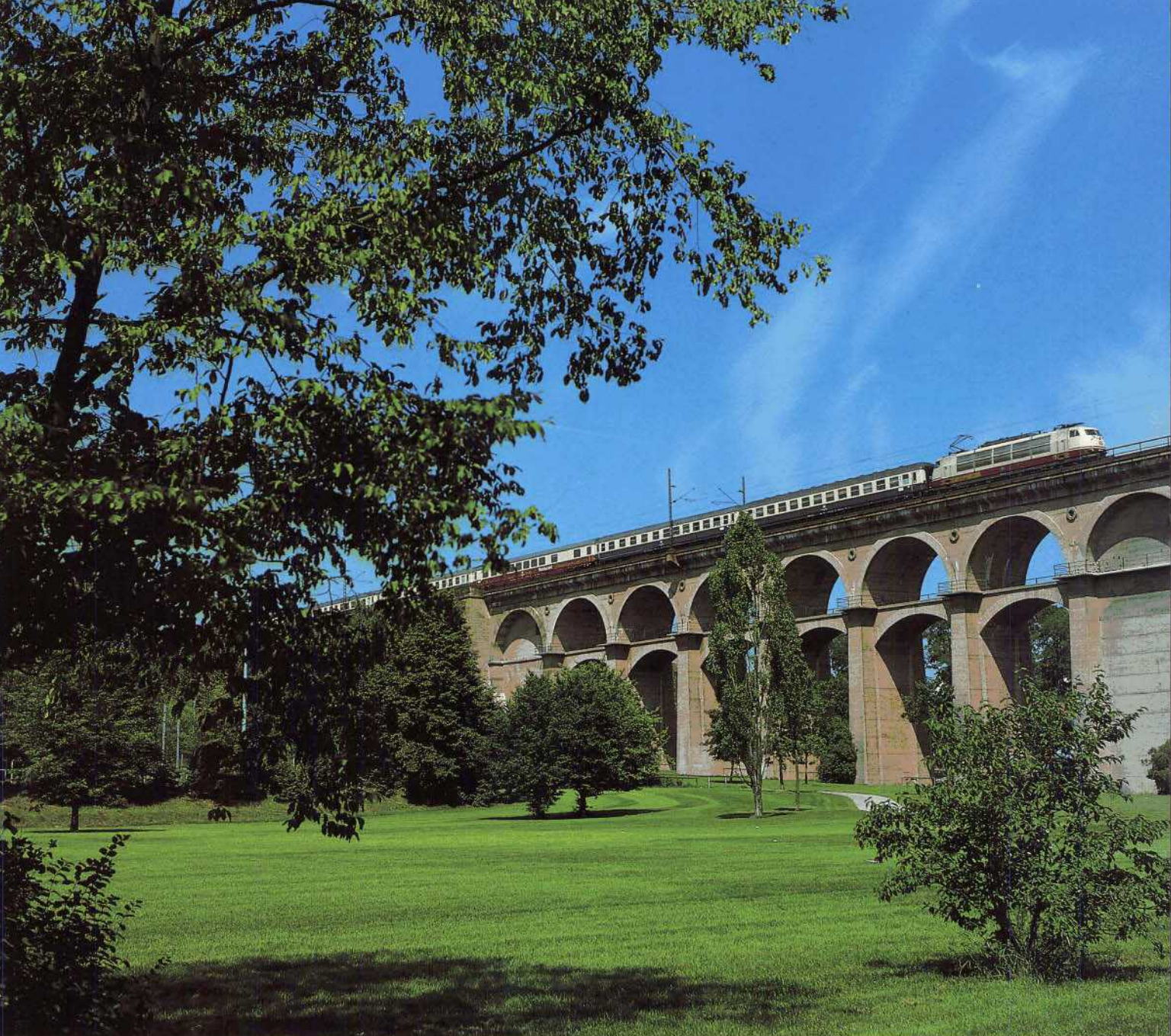
Bild 10: Nur von 1987 bis 1991 verkehrte der FD TEGERNSEE Dortmund – Tegernsee (mit Flügelzug AMMERSEE Augsburg – Mittenwald, siehe Bild 11): Gezogen von einer 103 rollt FD 1917 nach Tegernsee über das Bietigheimer Enzviadukt gen Süden.