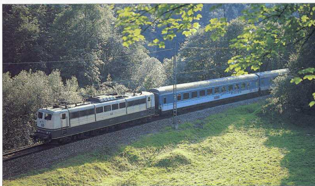
Bild 6 (rechts): Nur kurz im Einsatz war der "Kinderland"-Wagen im FD KÖNIGSSEE Hamburg – Berchtesgaden, der am 19. Juli 1989 auf dem letzten Abschnitt ab Freilassing mit der 151 104 bespannt ist (beim ehemaligen Hp Gmundbrücke).

bayerischen Landeshauptstadt traf hier auch der FD 781 KÖNIGSSEE aus Hamburg ein. Beide FDs übergaben ihre Kurswagen nach Zell am See einem Schnellzug und setzten im Zehn-Minuten-Abstand die Fahrt Richtung Freilassing fort. Dort tauschten sie eine Wagengruppe gegenseitig aus: FD 211 gab die Wagen Trier – Berchtesgaden an FD 781 ab und übernahm von diesem die Wagen Hamburg – Klagenfurt. Keineswegs analog gestaltete sich die Zusammenstellung des Gegenzugs FD 210. Die ab München eingereichten "Tiroler Wagen" kamen aus Bischofshofen, die Kurswagen nach Kassel wurden statt in Heidelberg in Darmstadt umgestellt. 1988 wurde das Zugpaar 211/210 zum EuroCity aufgewertet; erhalten blieben dabei auch die Kurswagen nach und von Tirol.