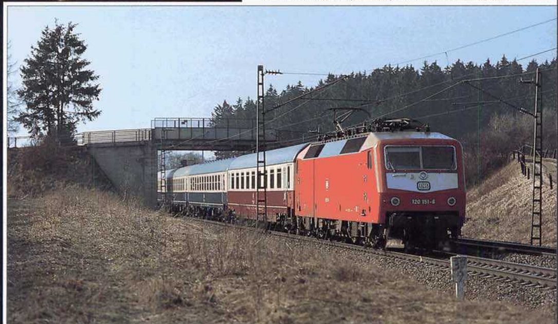
Bild 2: Als Flügelzug des FD ALPENLAND verkehrte der WERDENFELSER LAND zuletzt von Augsburg via München nach Mittenwald (mit 120 151 am 19. März 1993 bei Haspelmoor).

Bild 1 (links): Ein "Klassiker" unter den Fern-Express-Zügen ist der BODENSEE Dortmund – Konstanz: Am 12. Oktober 1990 ist FD 1903 ab Offenburg mit einer 139 bespannt (bei Nußbach kurz vor der Einfahrt in den Tannenwaldtunnel).