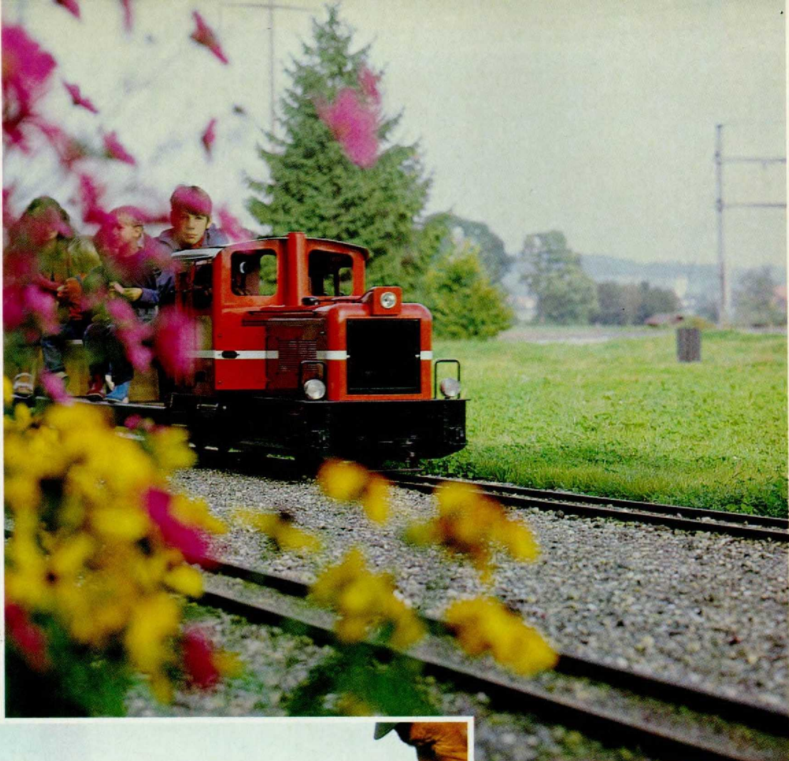
Abb. 1. „Diesellok mit Blütenschmuck“: Ein stimmungsvolles Frühlingsbild, das Fotograf Rolf Ertmer aus Altenbeken ebenso auf der Freiland-Anlage in Stein am Rhein/Schweiz gelang wie ...