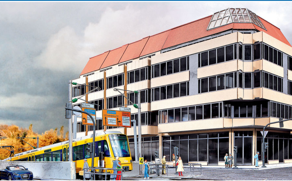
Das Olgaek in Stuttgart hat Christian Jabs im Maßstab 1:87 treffend dargestellt. Das Schaustück von Stadt im Modell zeigt kompromisslose Neuheiten in H0. Die Straßenbahnunterführung soll im Herbst erscheinen.

„Weltmeister 2014, vielleicht auch Europameister 2016? Man darf ja mal träumen“, das denken sich auch die Amateurfußballer auf dem kleinen regionalen Fußballplatz. Oder sind die Kicker etwa Nationalmannschaften beim Training. Bei Noch kann man sich bald die Mannschaften und Fans selbst zusammenstellen.