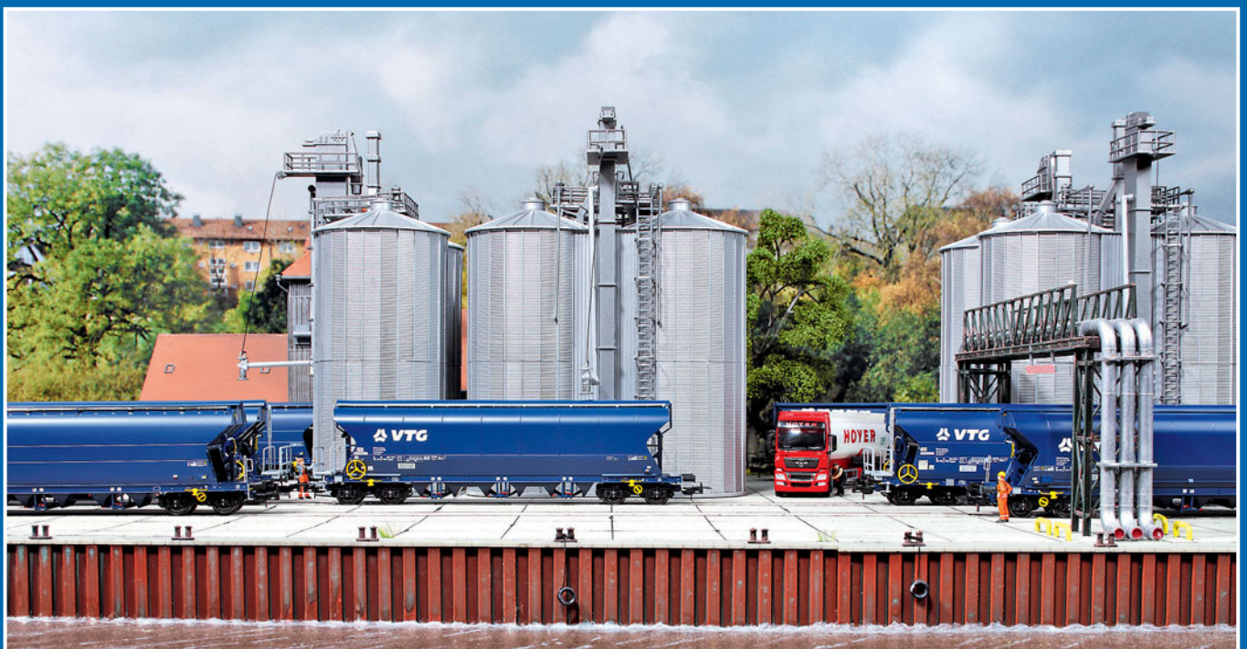
Die Silowagen von NME waren der Anlass für Thomas Friedel, ein passendes H0-Schaustück mit Siloverladung in einem Binnenhafen zu gestalten.