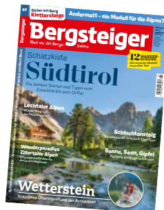
Cover: Kleine Fanesalm, Dolomiten; Foto: Manfred Kostner

Mehrheit hinter dem Projekt stehen. Im Interview zeigte sich Samih Sawiris offen und reflektiert. Ein Modell für die Alpen kann Andermatt wohl aber nur in Ausnahmefällen sein (S. 42–49). Viel Freude beim Lesen wünscht Ihnen Ihr