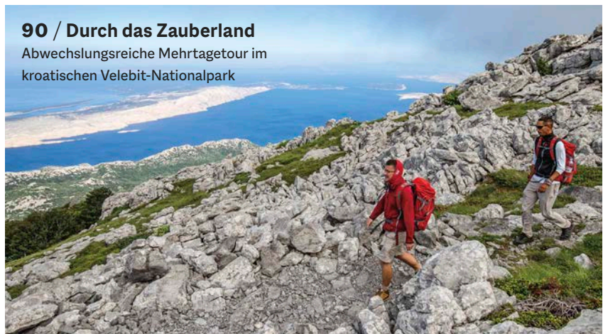
90 / Durch das Zauberland Abwechslungsreiche Mehrtage tour im kroatischen Velebit-Nationalpark