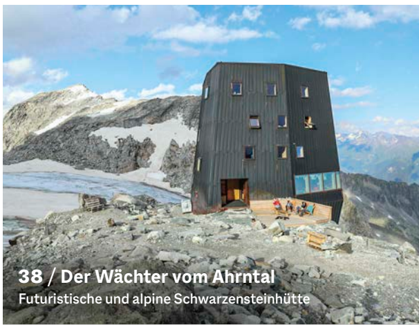
38 / Der Wächter vom Ahrntal Futuristische und alpine Schwarzensteinhütte