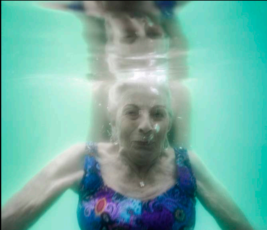
90 Wenn das Wesen eines Menschen langsam verschimmt: Demenz und ihre Folgen