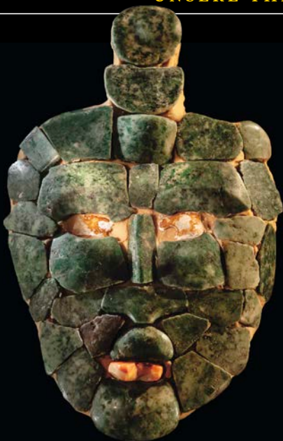
30 Kunstvolle Jademosaikmaske der Maya