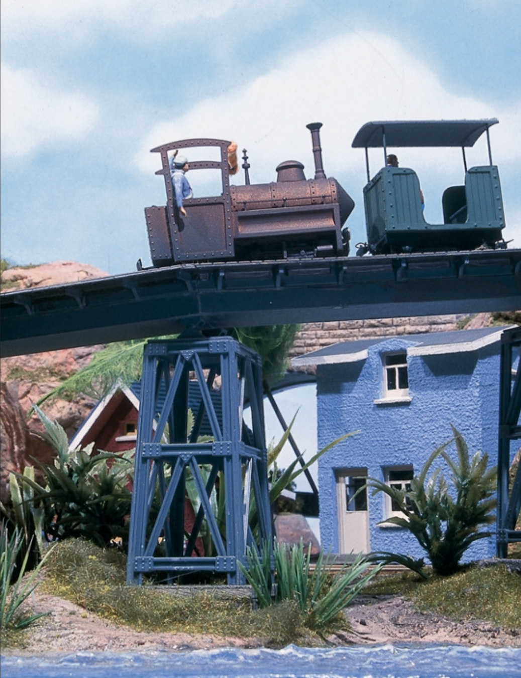
Auf kühnen Brückenbauwerken erklimmt das Züglein den steilen Bergesrückén. Das Erscheinungsbild der ursprünglichen Dampflok orientiert sich am Modell der Augsburger Puppenkiste. Der obere Umsetzpunkt am Schloss ist platzmáßig so beschránkt, dass eine Schwenkbühne als Weichenersatz zum Einsatz kommen muss; mit im Bild ein selbst gebauter Diesel.