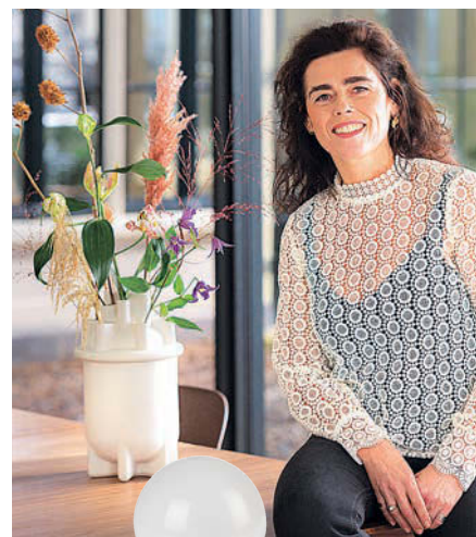
Per Fingertip dimmbare Tischleuchte „Gio“, ca. 55 Euro (Zuiver)