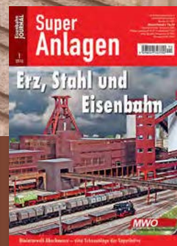
Erz, Stahl und Eisenbahn Miniaturwelt Oberhausen Best.-Nr. 671001 · € 13,70