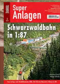
Schwarzwald in 1:87 H0-Anlage v. Modellbauteam Köln Best.-Nr. 671002 · € 13,70