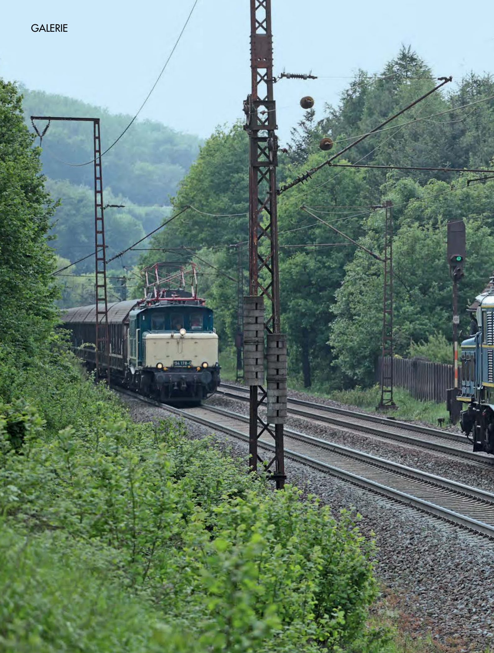
ALTE HAUDEGEN – TEIL 1 ■ Zu einem im planmäßigen Bahnalltag anno 2011 eher ungewöhnlichen Zusammentreffen kam es am 13. Mai auf der Spessartrampe bei Block Hain. Während die im dortigen Schiebedienst eingesetzte 1020 041 (ex DRB/ÖBB E 94 103) der Mittelweserbahn talwärts nach Laufach rollt,