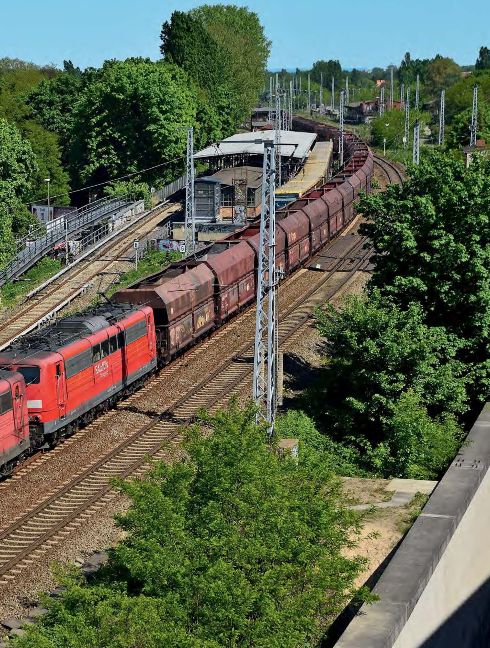
9. Mai 2011 waren es 151 098 und 151 160, hier bei der Durchfahrt in Berlin-Köpenick. – Bahnhof und Umfeld werden sich hier übrigens infolge von Abriss-, Rück- und Umbaumaßnahmen in Kürze sehr verändern. Nicht realisiert wird dagegen aus Spargründen ein hier ursprünglich geplanter Regionalbahnhof.