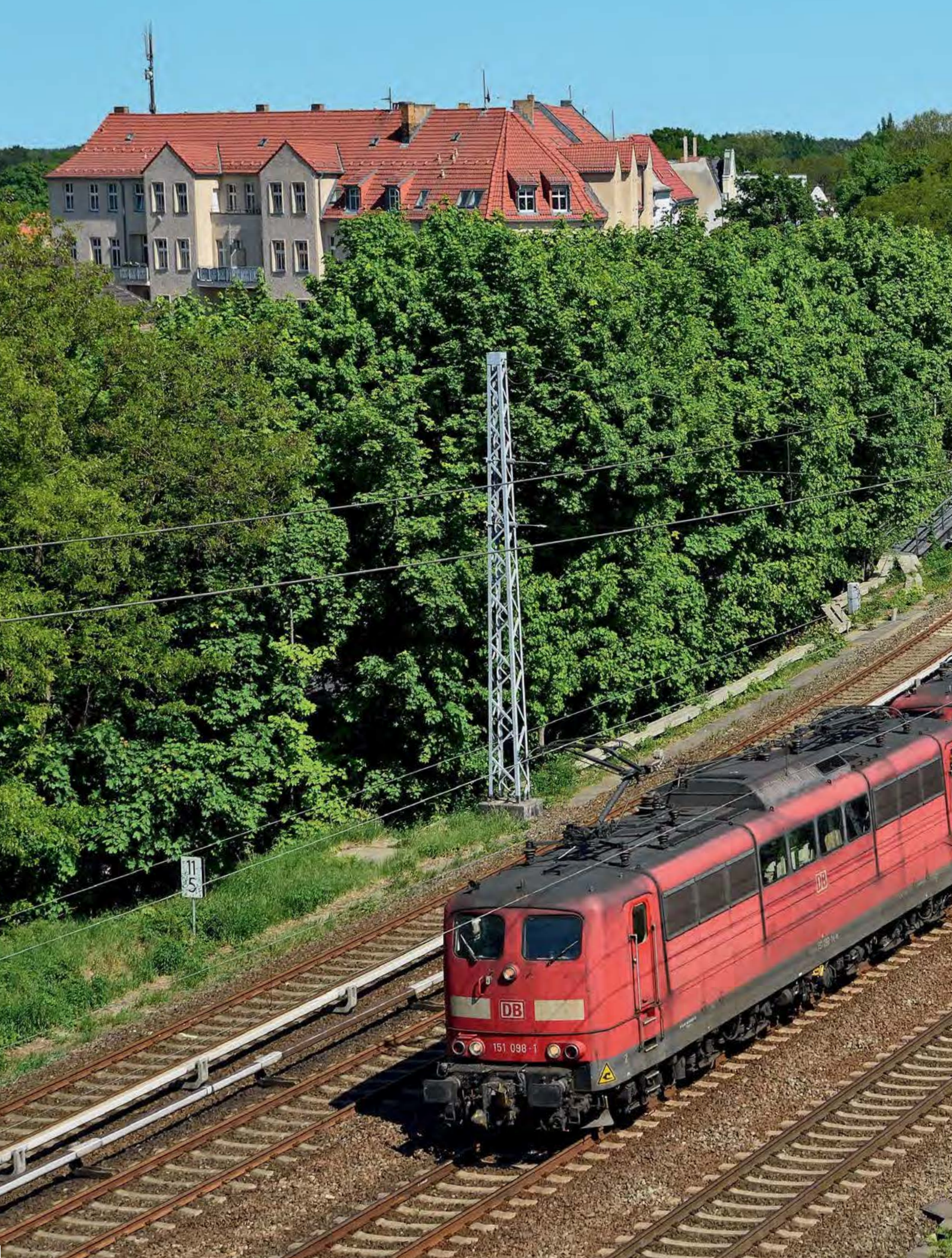
ALTE HAUDEGEN – TEIL 2 ■ Obwohl die Bespannung des CS 60226 von Ziltendorf in Südbrandenburg nach Hamburg vor knapp einem halben Jahr von der Baureihe 151 auf 185 überging, sind die sechsachsigen Bundesbahn-Boliden aus den 70er Jahren nach wie vor mitunter vor dem Erz-Leerzug anzutreffen. Am