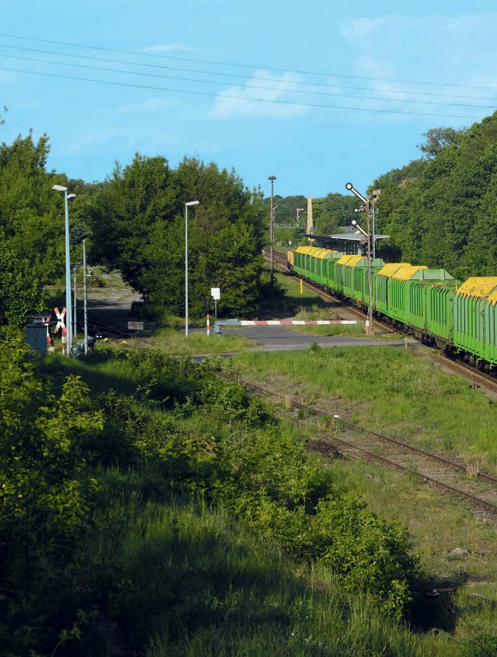
ALTE HAUDEGEN – TEIL 3 ■ Schon 40 Jahre sind die 204 347 und 354 der Muldental-Eisenbahnverkehrs-gesellschaft (MTEG) im Geschäft. Die DB AG führte die als 110 347 und 354 an die DR gelieferten, später in 112 347 und 354 umgezeichneten Loks zuletzt als 202 347 und 354. Ihre heutigen Nummern