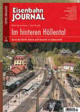
Im hinteren Höllental Durch das Tal der Gutach Best.-Nr. 670802 · € 13,70