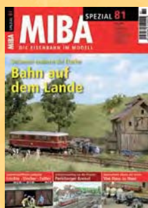
MIBA-Spezial 81/09 Bahn auf dem Lande Best.-Nr. 120 88109