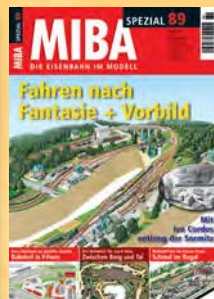
MIBA-Spezial 89/11 Fahren nach Fantasie + Vorbild Best.-Nr. 120 88911