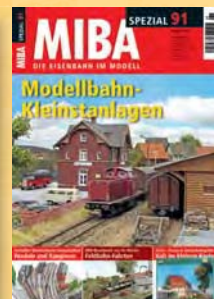
MIBA-Spezial 91/12 Modellbahn-Kleinanlagen Best.-Nr. 120 89112