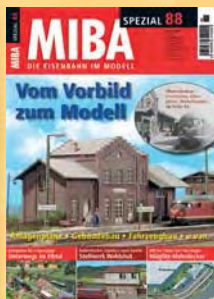
MIBA-Spezial 88/11 Vom Vorbild zum Modell Best.-Nr. 120 88811