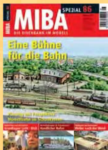
MIBA-Spezial 86/10 Eine Bühne für die Bahn Best.-Nr. 120 88610