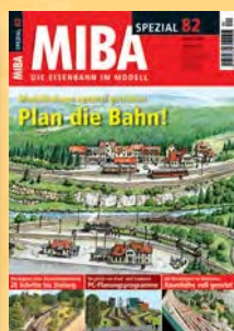
MIBA-Spezial 82/09 Plan die Bahn Best.-Nr. 120 88209