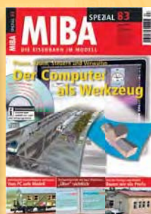
MIBA-Spezial 83/10 Der Computer als Werkzeug Best.-Nr. 120 88310 inkl. DVD