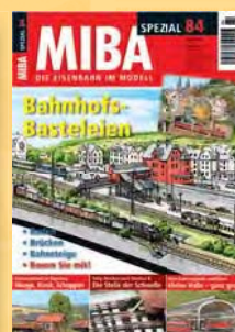
MIBA-Spezial 84/10 Bahnhofsbasteleien Best.-Nr. 120 88410