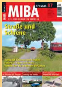
MIBA-Spezial 87/11 Straße und Schiene Best.-Nr. 120 88711