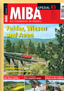
MIBA-Spezial 85/10 Felder, Wiesen und Auen Best.-Nr. 120 88510