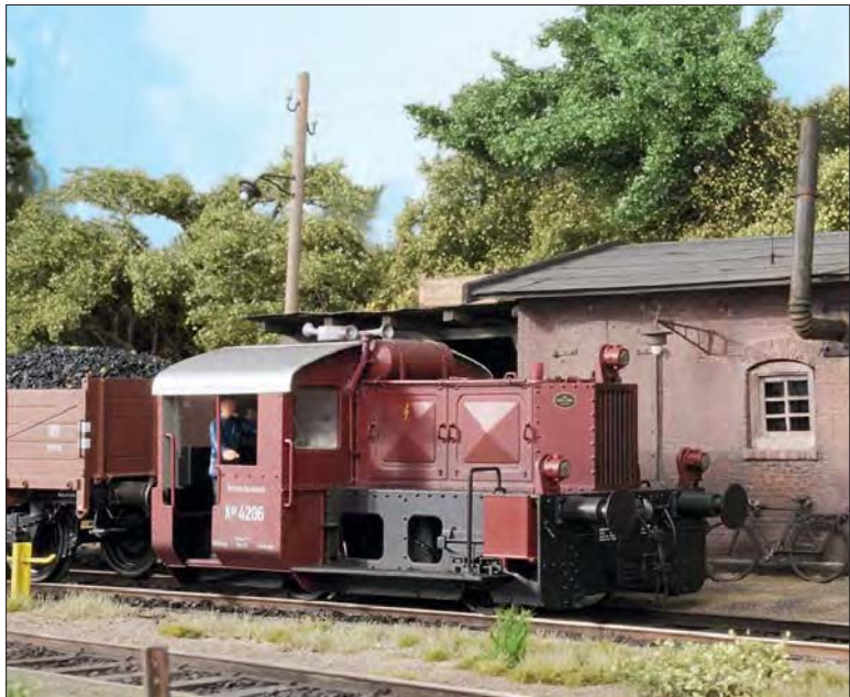
26 Manche mögen es etwas kleiner und feiner – und wenn es nur das Anschlussgleis einer Kohlenhandlung mit Umsetzungöglichkeit ist. Hans Hagner baute hier ein echtes Kleinod in der Nenngröße 0.

Exklusive Baummodelle und Modell-Landschaftsbegrünung