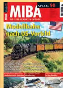
MIBA-Spezial 90/11 Modellbahn nach US-Vorbild Best.-Nr. 120 89011