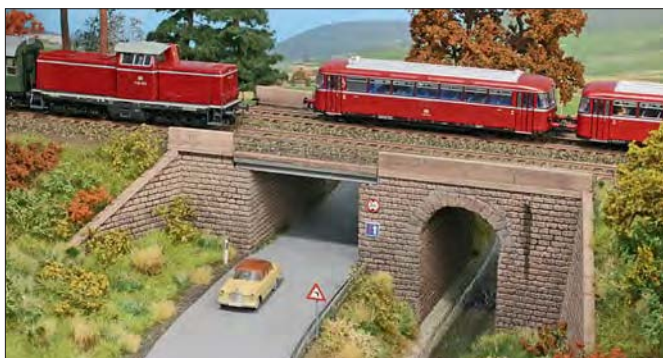
56 Die kleine Brücke nach einer Zeichnung von Pit-Peg bietet mit ihren beiden Durchlässen ein reizvolles Modellbahnmotiv. Thomas Mauer baute sie auf einer Anlage ein.