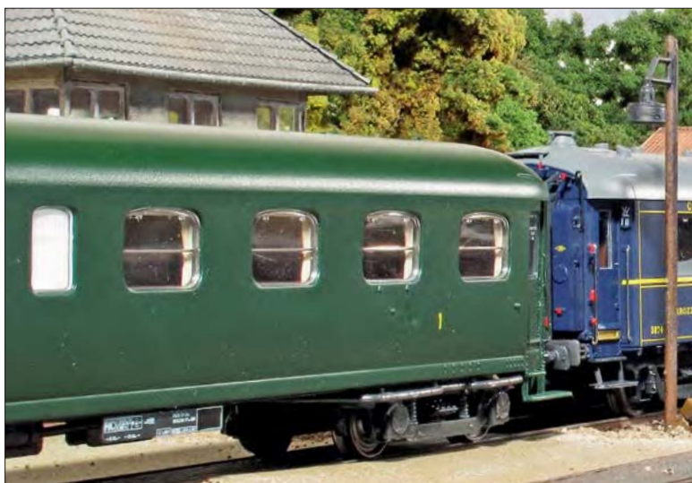
32 Endlich rollt der F 11 durch Ottersberg! Otto Humbach zeigt, ob sich das Warten auf die Wagenmodelle von L.S.Models gelohnt hat ...