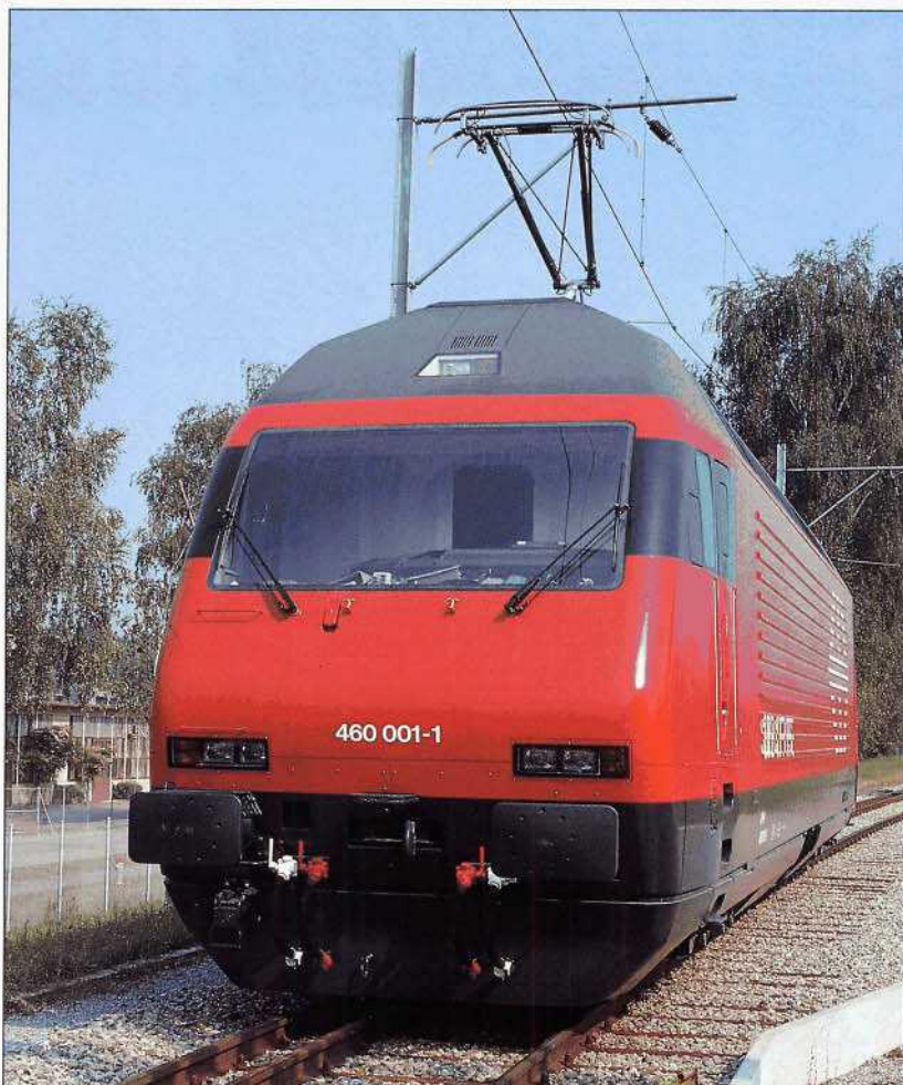
Die von der Schweizer Lokomotivindustrie entwickelte "Lok 2000" (SBB-Baureihe 460) – Design Pininfarina – leistet maximal 6100 kW (Dauerleistung 4800 kW). Über Entwicklung und Erprobung des neuen Triebfahrzeugs berichten wir ab Seite 12.