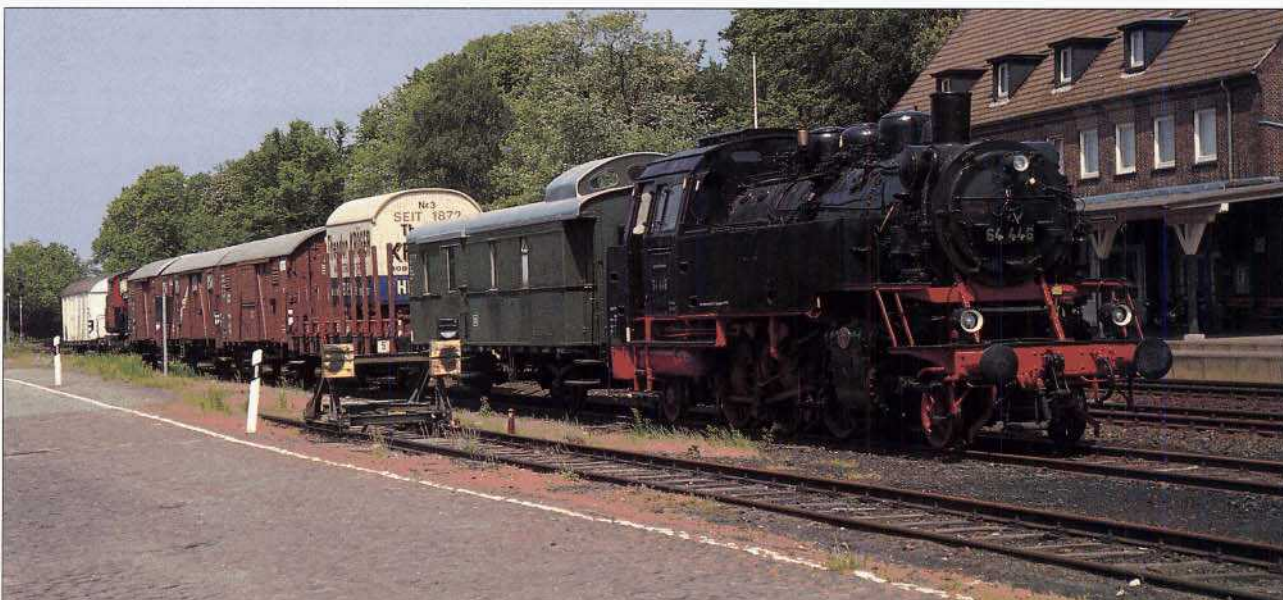
Bild 7: Bestens restauriert steht die 64 446 (vom 28. Januar 1960 bis 29. Mai 1965 beim Bw Hamburg-Eidelstedt) heute im Bahnhof Glückstadt.