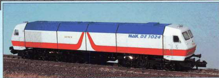
Bild 8 (oben): Überzeugend in Technik und Design: MaK-DE 1024 (Baureihe 240) – im Vorbild (Kiel Hbf) und...