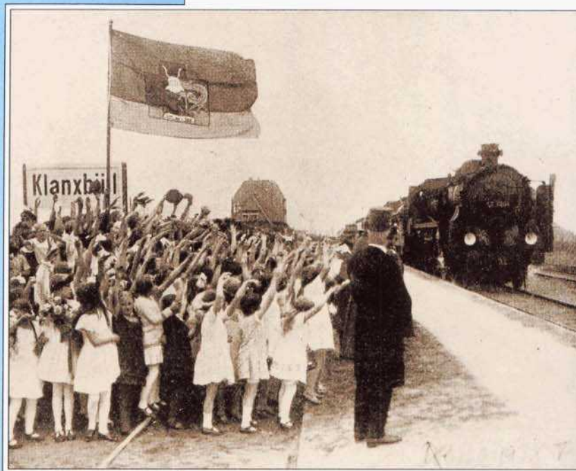
Bild 2: Am 1. Juni 1927 wurde die Strecke über den Hindenburgdamm eröffnet.