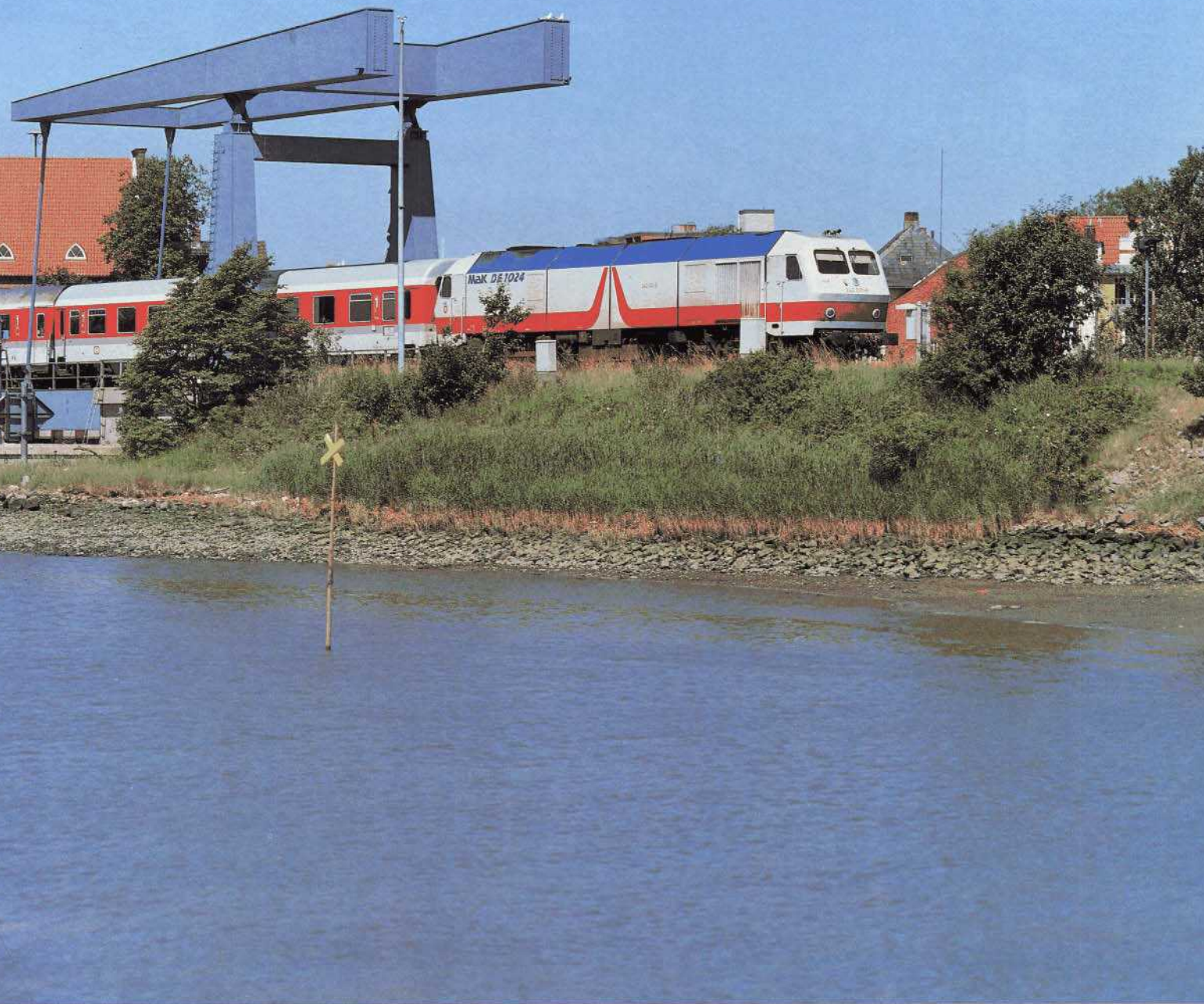
Bild 10: Die Baureihe 240 ist nicht nur in der Lage, 218-Doppeltraktionen zu ersetzen, sondern bietet auch etwas fürs Auge: 240 001 mit IC 827 bei Husum (29. Juli 1991).

werden kann. Mit zu dieser relativierenden Einsicht beigetragen haben nach Einschätzung von Fachleuten auch die Erfahrungen mit den vierachsigen Grenzleistungs-Universal-E-Loks der Baureihe 120.