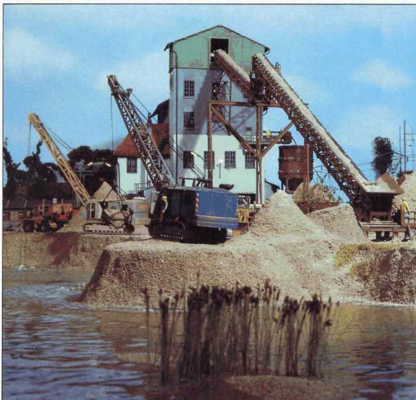
Entlang der Bourne führt diesmal die Fahrt zwischen Lyon und Marseille (Seite 60). Auch in diesem sechsten Beitrag demonstriert unser Leser Wolfgang Müller wieder perfekten Modellbau mit zahlreichen gekonnt gestalteten Motiven.

Titelbild: Die von der Deutschen Reichsbahn vermietete BoBo-Lokomotive 143 922 am 15.05.1992 während des Einsatzes auf der Strecke Wädenswil – Einsiedeln der Schweizerischen Südostbahn (SOB). Im Hintergrund der Zürichsee.