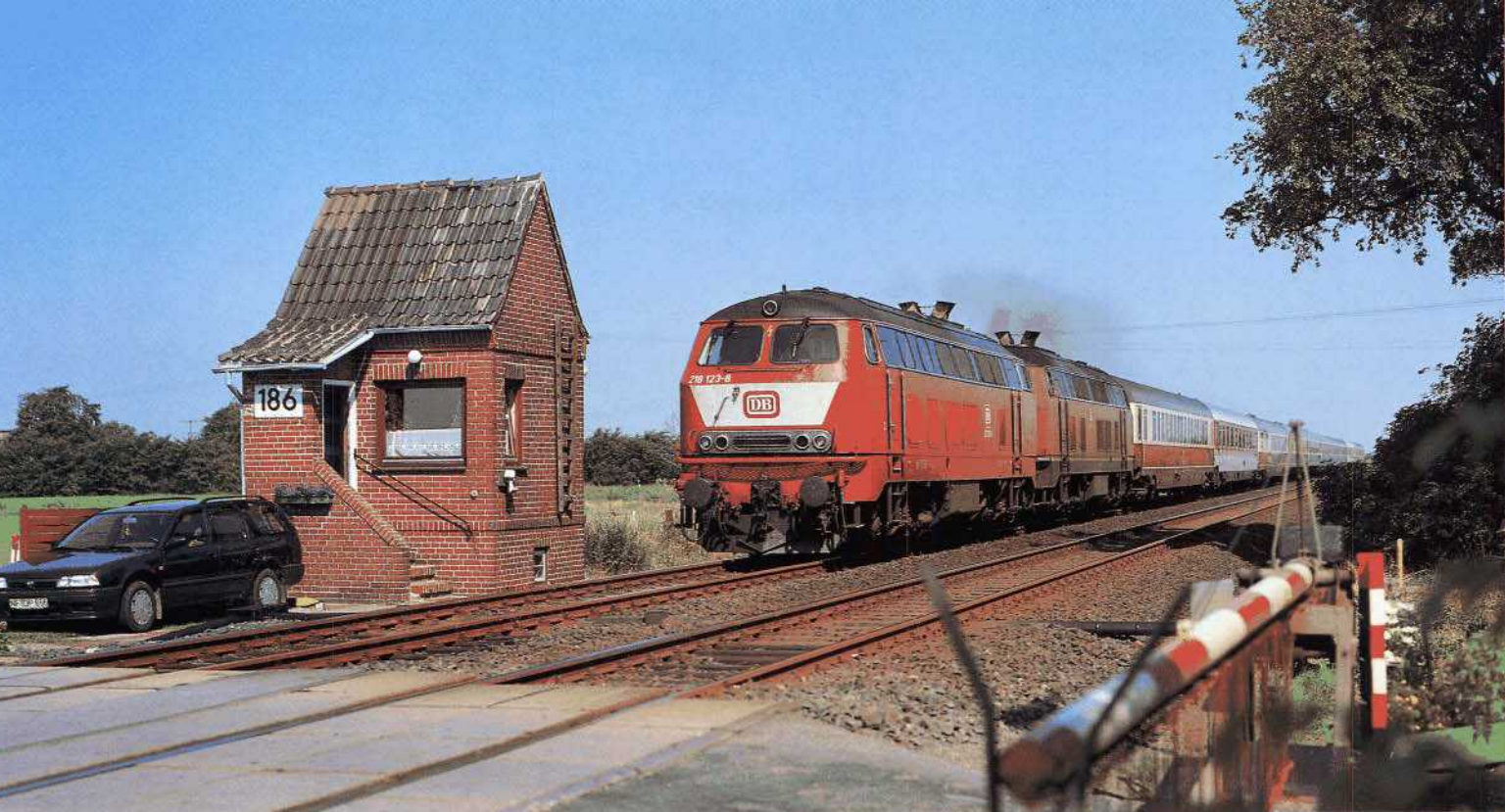
Bild 4: Mit IC 135 "Emil Nolde" passiert eine 218-Doppeltraktion den Schrankenposten bei Langenhorn (30. Juli 1991).

auch im September 1956 nichts, als Altona mit der V 200 006 den ersten roten Diesel-Giganten erhält. Aber schon im Sommerfahrplan 1957 tauchen die ersten V 200 aus Altona in Westerland auf – der Strukturwandel in der Zugförderung hat begonnen.